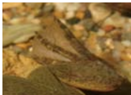
具有3對有爪腳趾的後肢

特徵 | 體長10公分左右，身體扁平、流線型，雄性比雌性體型小，體色灰色至黑色，後肢具有3對有爪的腳趾。本種經常作為實驗動物使用。