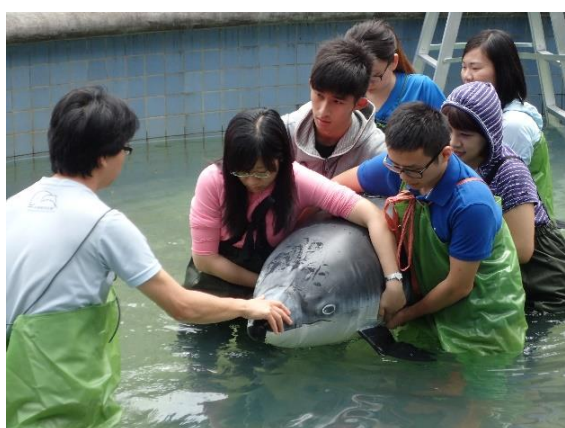
◆ 模擬活體擱淺救傷照護