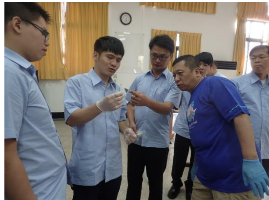
◆ 實際操作鯨豚肉檢驗試紙