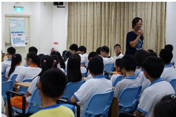
◆ 與台下高中生互動認識鄰居白海豚