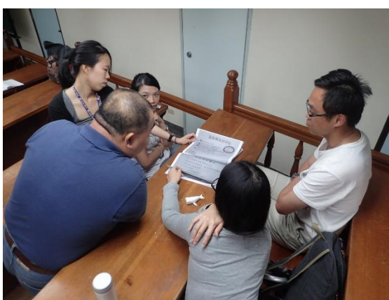
◆ 賞鯨行前解說員訓練