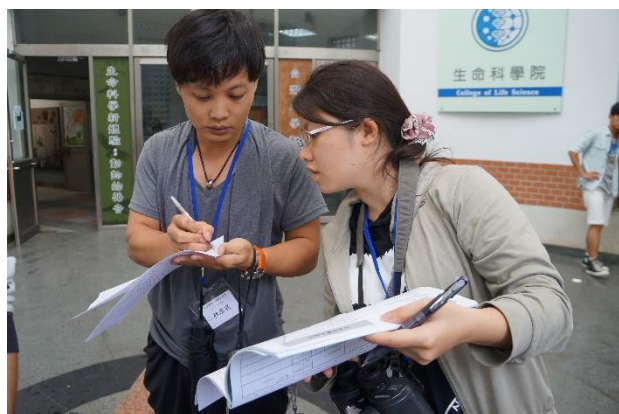
◆ 5/24 學習如何填寫記錄表