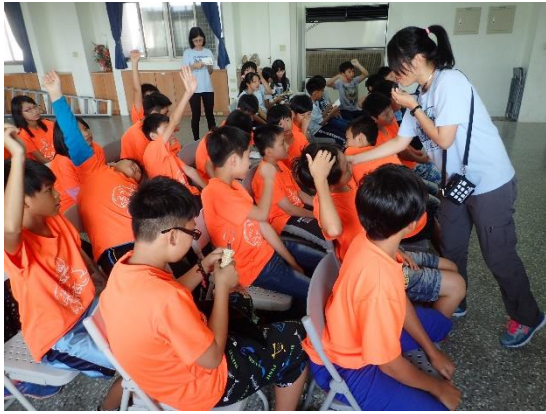
◆ 學生們熱烈回答問題