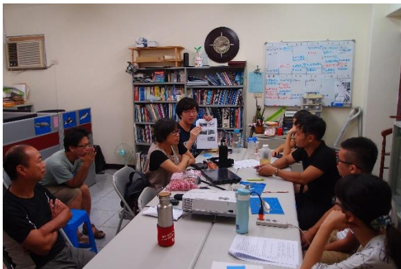
◆ 鯨豚教推教案演練-教案討論