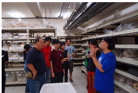
◆ 到科博館觀看鯨豚標本典藏