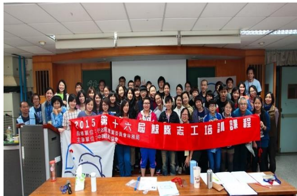
◆ 參與 2015 志工培訓的學員們

進階訓練於 4 月 18 日、5 月 16 日、6 月 27 日，與系列進階培訓課程配合辦理共計 12 場，協助志工投入鯨豚之擱淺、教育推廣、賞鯨解說、研究調查等工作。本年度持續管理鯨豚志工，其中教推活動服務對象達 156 人次。