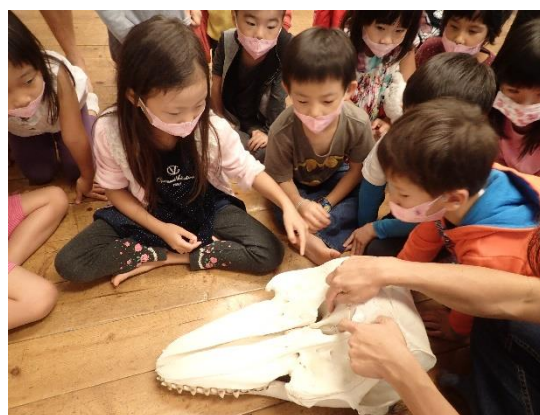
◆ 哇~偽虎鯨的鼻孔在這!