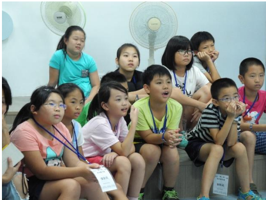
◆ 小梧子吃了好多塑膠袋喔~