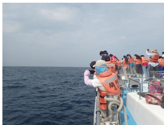
◆ 5/31 海上實習調查