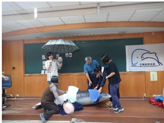
◆ 鯨豚擱淺救援演練