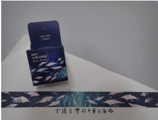
◆ 鯨豚宣導品「白海豚紙膠帶」