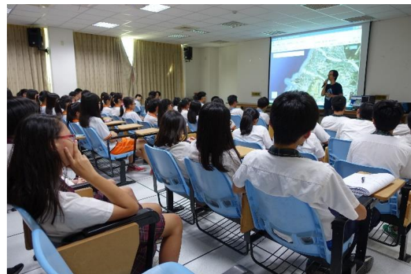
◆ 海上調查方法介紹