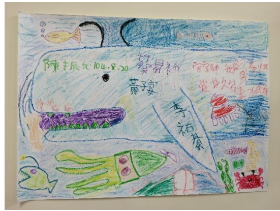
◆ 學員所回饋的畫作