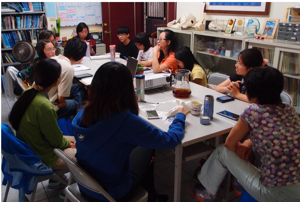
◆ 激盪構想活動內容