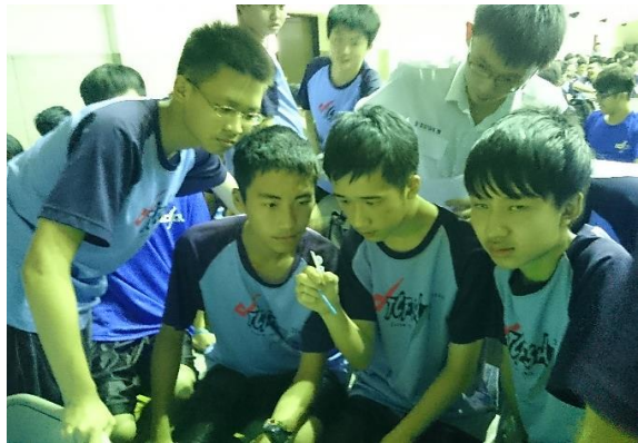
◆ 學生認真學習試劑使用方式