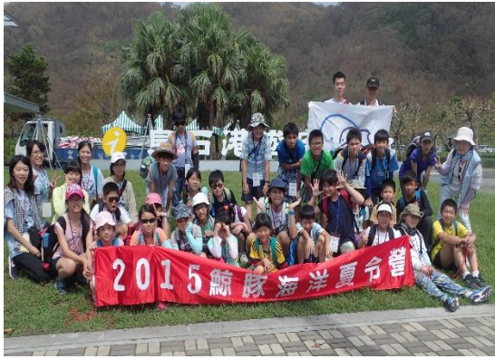
◆ 於烏石港的大合照