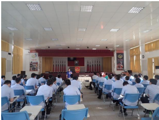
◆ 介紹鯨豚骨骼基本構造