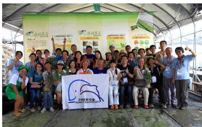
◆ 2015年鯨豚海洋教育種子教師研習合照