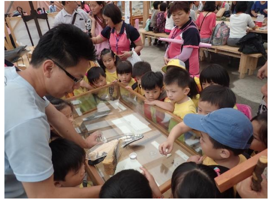
◆ 第一次與鯨魚標本接觸