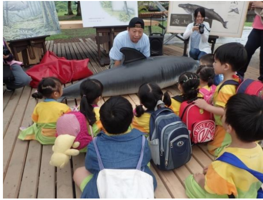
◆ 原來要這樣救救鯨鯨