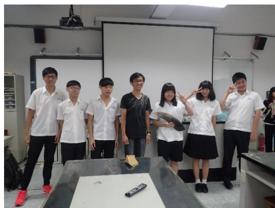
◆ 學生很開心對鯨豚有更多的瞭解