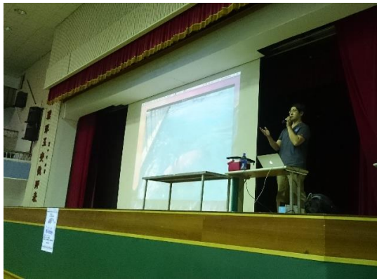
◆ 分享鯨豚救傷實務經驗談