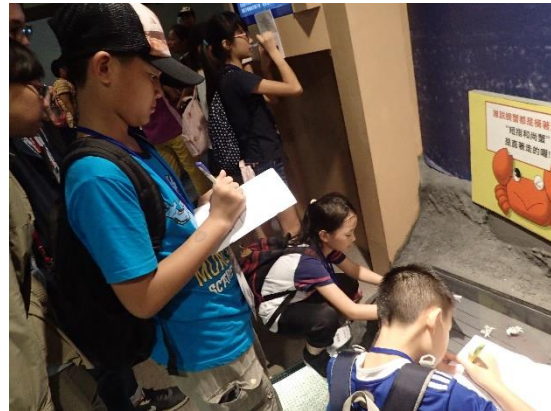
◆ 跟著泰雅族及小水滴冒險

本次夏令營除了提供鯨豚知識面向外，更希望藉由實際案例及出海賞鯨提升學員對海洋的情意面，並從中宣導落實海洋保育從自身做起的概念。因此為了確認學員是否有所收穫，在夏令營的最後以圖畫的方式蒐集學員的回饋，從他們的分享中可看出，大部份的學員都有提到不要亂丟垃圾，並願意參與淨灘活動。而對於整個海洋知識及宜蘭外海的景色有更進一步的認識。