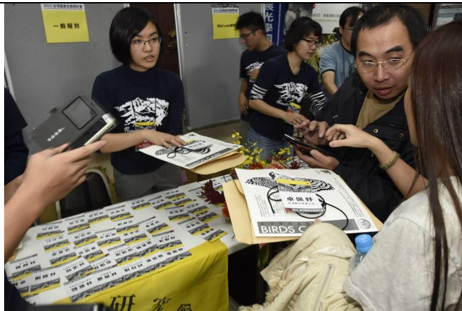
與會者獲得精美與會資料