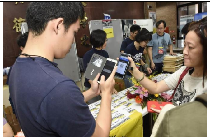
本次會議使用掃 QR Code 條碼確認報名，節省不少時間