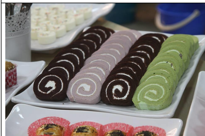
茶敘時間大會提供精心準備的餐點