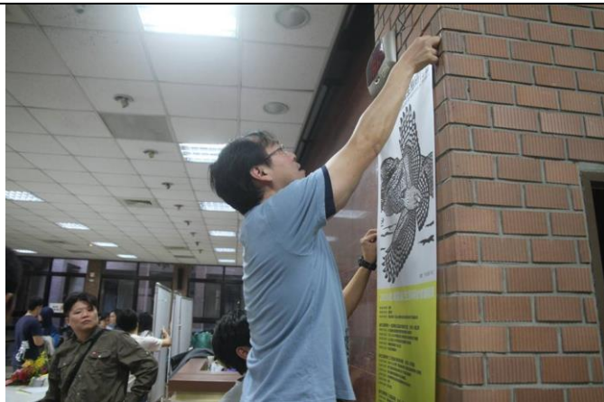
會議當天早上 8 點工作人員及到會場進行佈置及準備工作