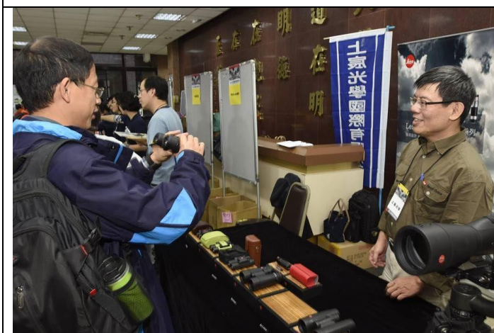
猛禽觀察工具望遠鏡展售