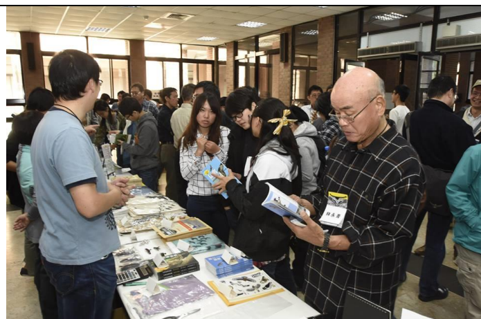
休息時間鷹仔鋪展售