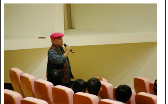
Kazangiljan 家族代表恩初日·卡札印覽提問