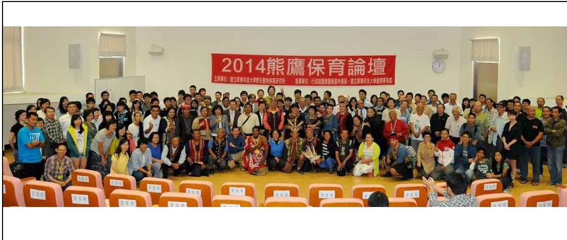
2014 熊鷹保育論壇參與者合照