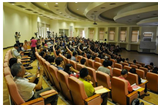
有志一同的與會者