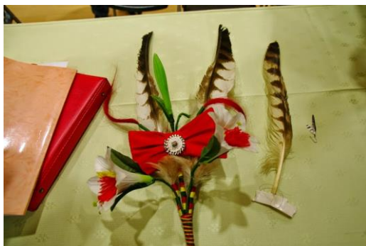
魯凱族頭目的頭飾