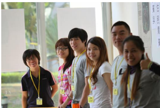
辛勤的野保所工作人員