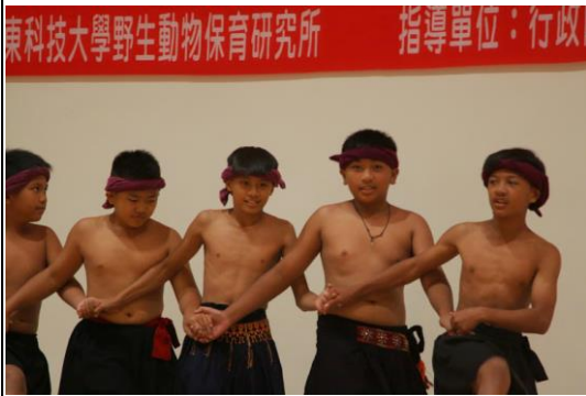
開幕表演：屏東縣來義鄉文樂國小的排灣族勇士之舞