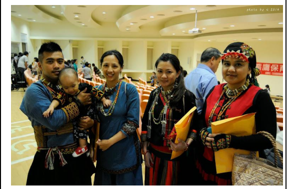
北排灣部落的傳統服飾