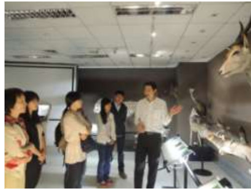
2013.10.26 鯨豚標本製作簡介 暨台大動物標本館參觀