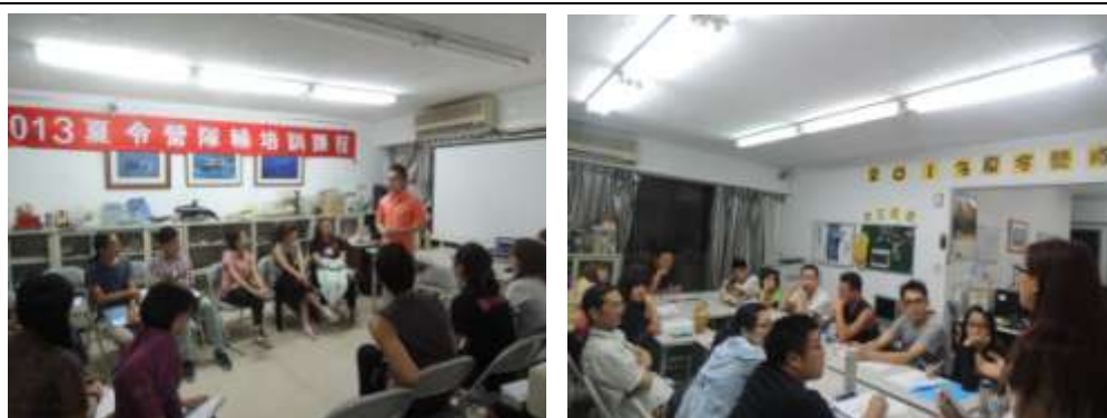
鯨豚海洋夏令營隊輔訓練暨工作會議

夏令營所需的隊輔志工皆於 102 年 7 月 04、11、22、30、31 日及 8 月 01、02 日參加隊輔培訓、隊輔工作會議、夏令營工作服務，上述日期分別有 17、14、11、16、17、17 及 17 名志工參與。其擔任課程組、活動組、服務組及生活組之規畫人員，以及正副小隊輔。三天中共帶領 25 名國、高中的年輕學子，並協助帶動活動氣氛，使活動順利進行。