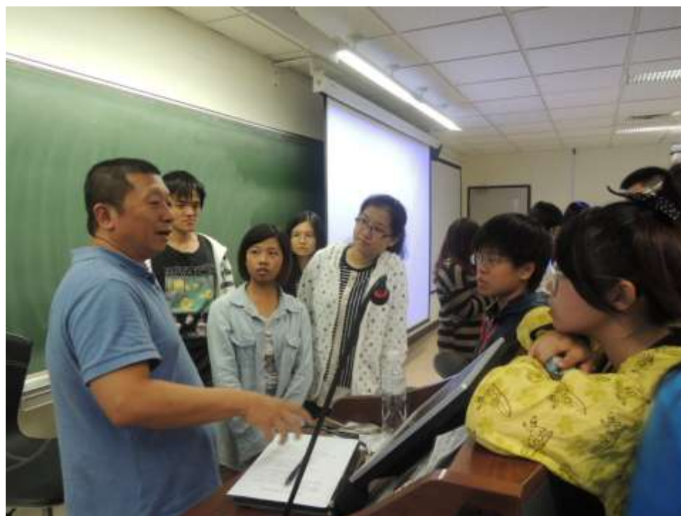
10/31 輔仁大學社團講座，課後大家積極提問。

2013 年 03 月 02 日及 10 月 31 日分別於空中大學台北中心慈愛社及天主教輔仁大學綠野社，聚集對鯨豚保育議題有興趣者，舉辦 2 場次之社團講座。透過講座學習到鯨豚的知識與環境保育的重要。2 場活動總計 81 人參加。