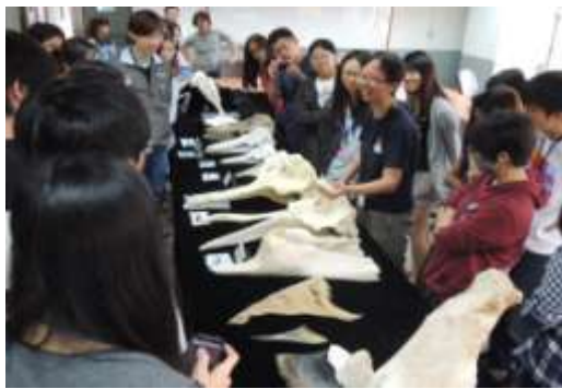
2013.03.23 志工培訓— 由骨骼標本認識鯨豚