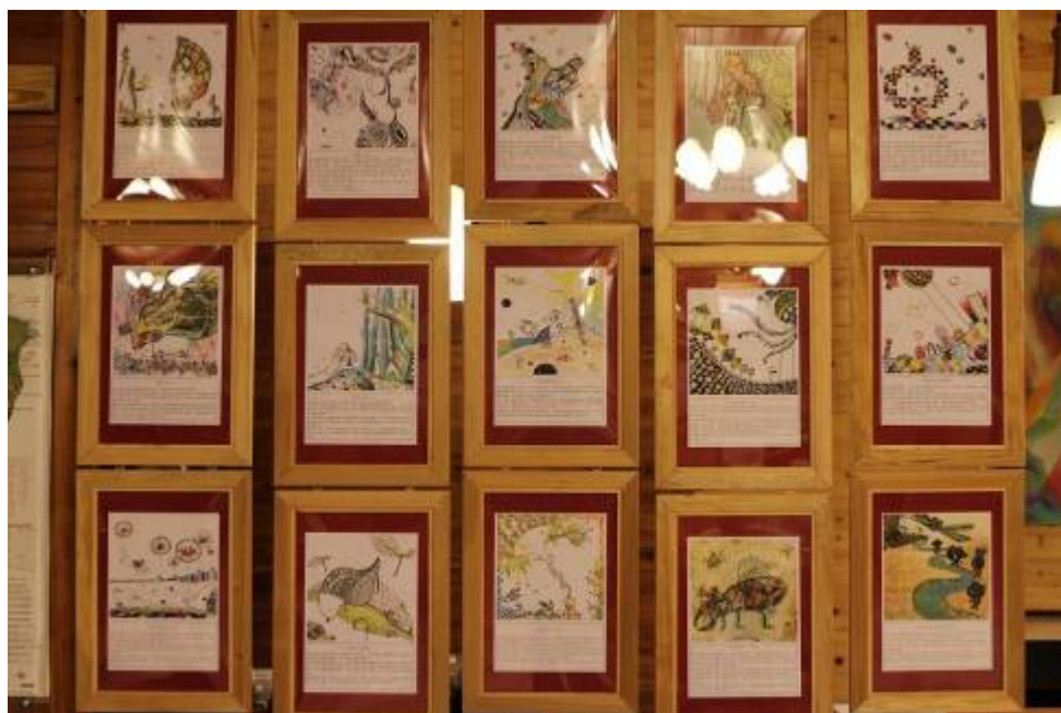
圖八、11月8~9日草嶺文創成果展之二