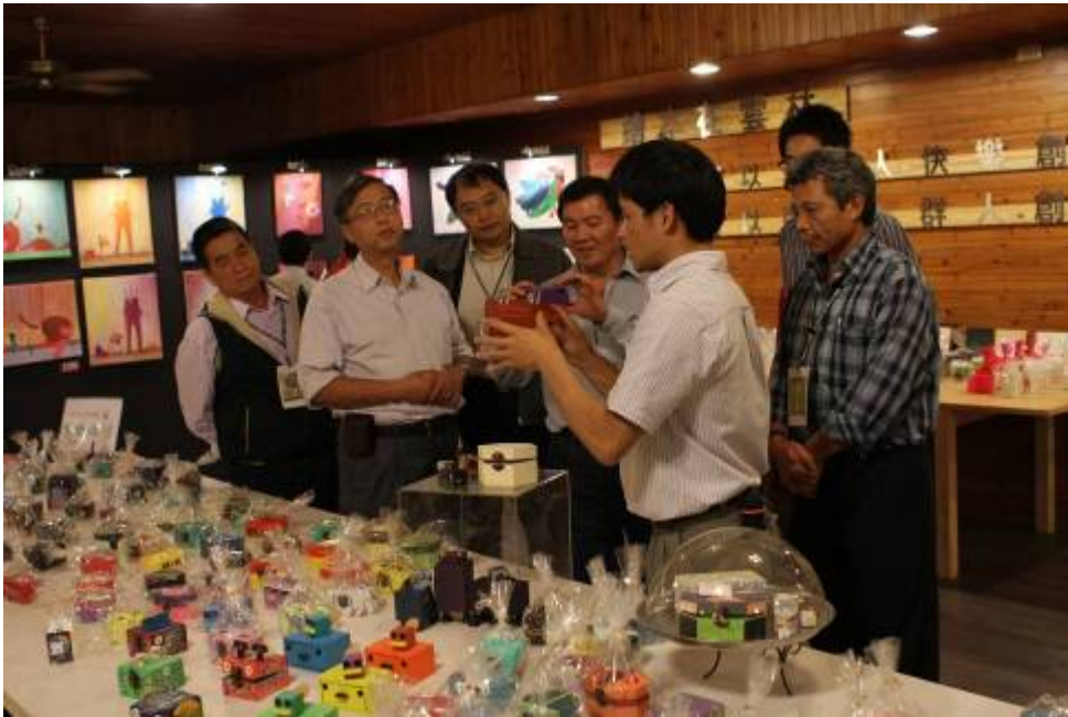
圖十、11月8~9日草嶺文創成果展之四