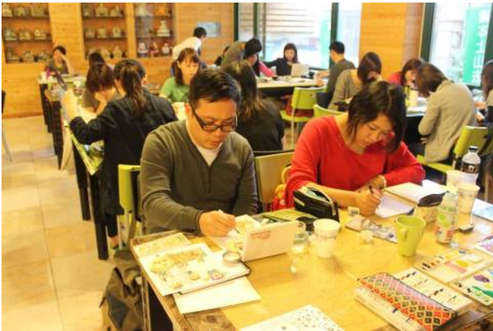
圖二、6月1~6日草嶺文創系列活動(繪本作家創作)