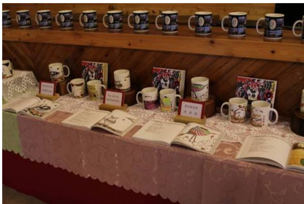
圖七、11月8~9日草嶺文創成果展之一