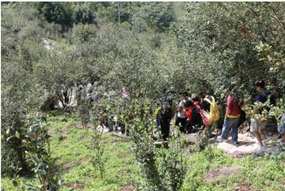
圖四、10月份生態紀錄研習營於草嶺活動