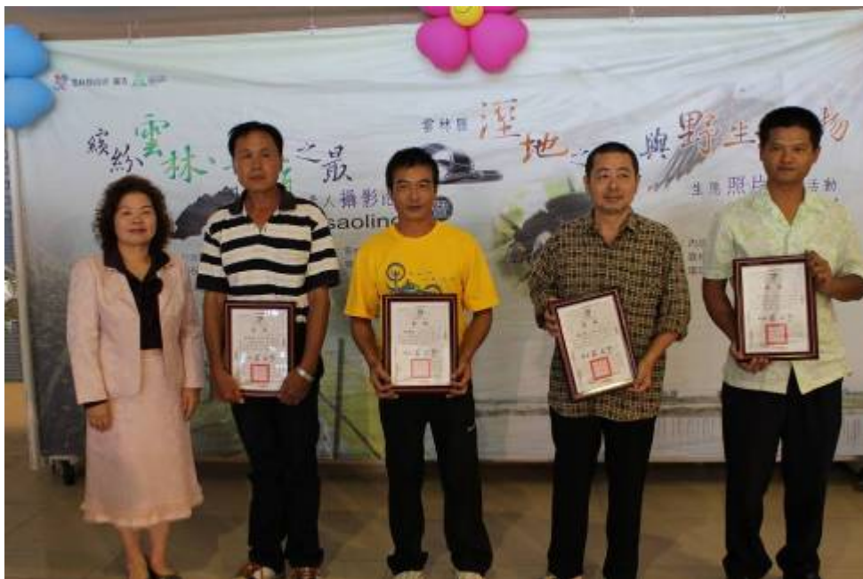
圖十三、11月13日【繽紛雲林·草嶺之最】攝影比賽頒獎記者會之二