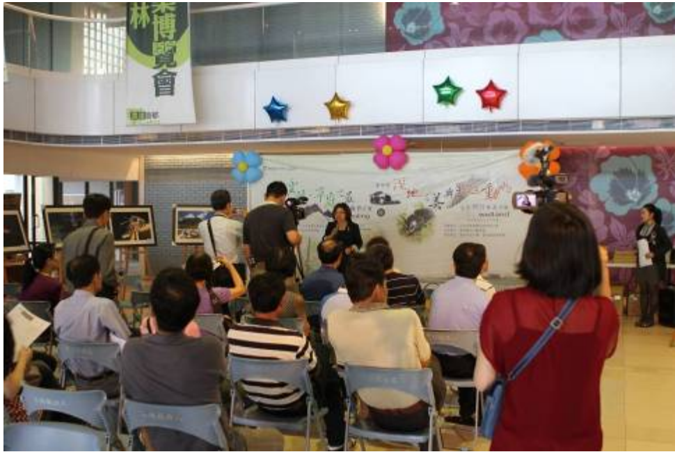
圖十三、11月13日【繽紛雲林·草嶺之最】攝影比賽頒獎記者會之一