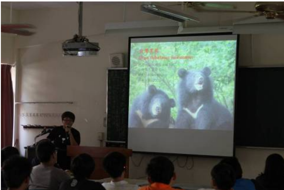
圖六、9、10 月份生態地景系列講座之二