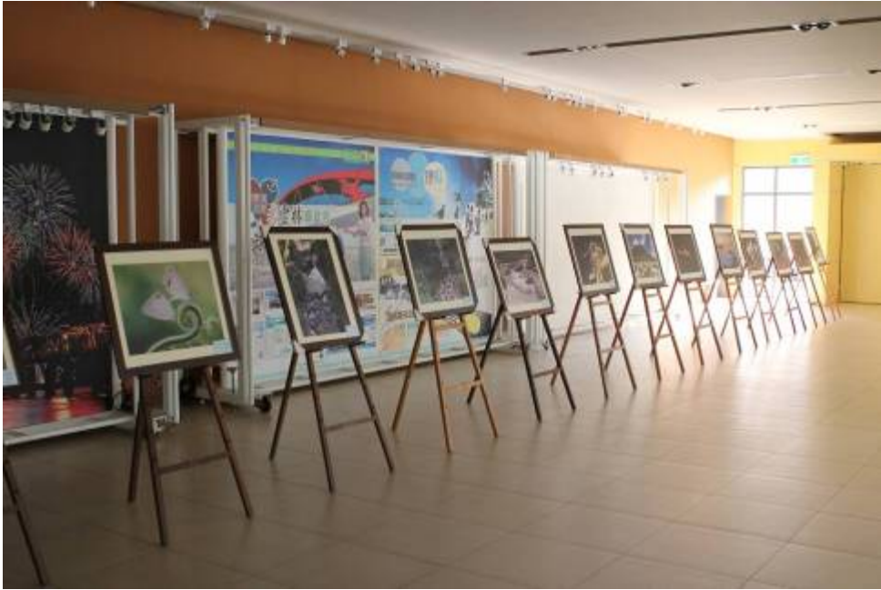
圖十四、11月13日【繽紛雲林·草嶺之最】攝影比賽成果展之一