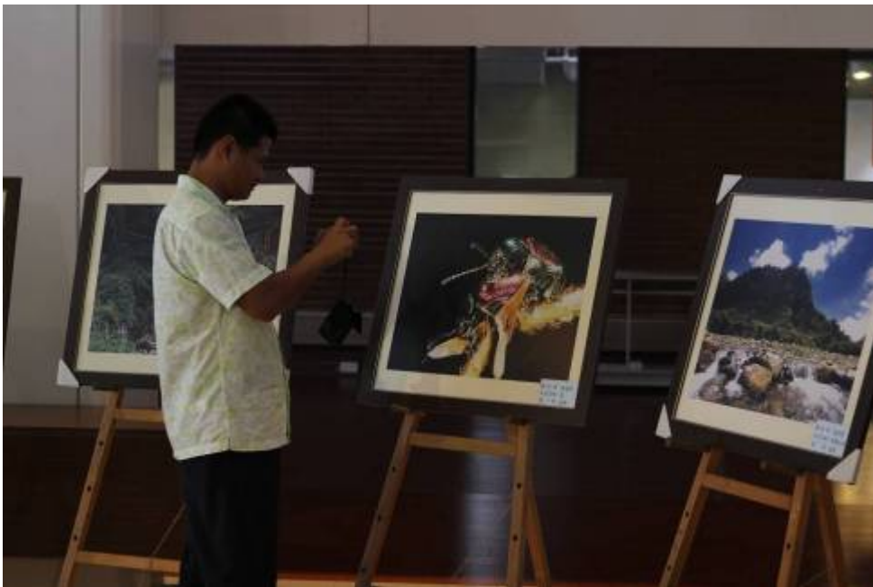
圖十五、11月13日【繽紛雲林·草嶺之最】攝影比賽成果展之二