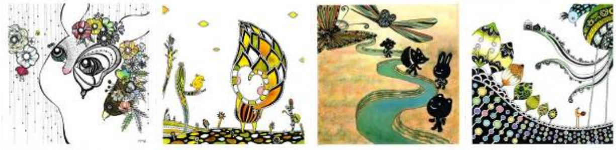
圖十二、草嶺文創成果部分稿件