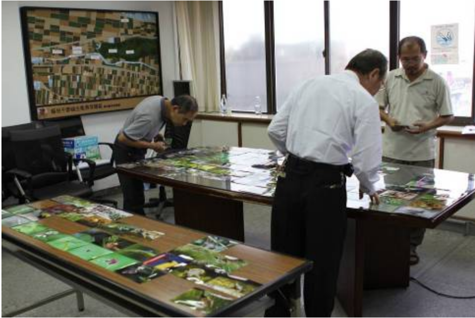
圖三、【繽紛雲林·草嶺之最】攝影比賽評選