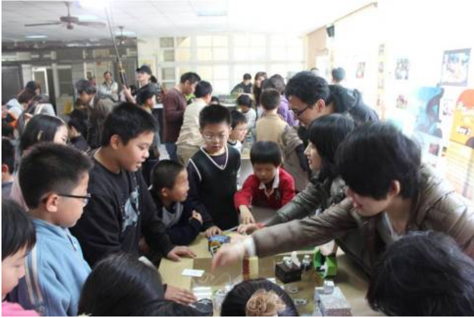
圖一、6月1~6日草嶺文創系列活動(於華南國小與學童共同創作)