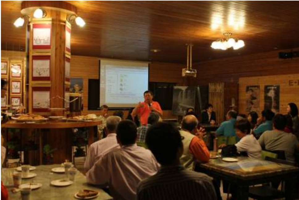
圖九、11月8~9日草嶺文創成果展之三