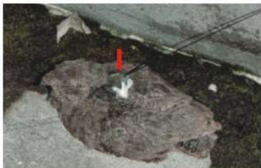
為了瞭解臺灣夜鷹冬季是否有蟄伏、遷徙行為，研究人員將夜鷹上裝設器(箭頭指向處)進行追蹤。