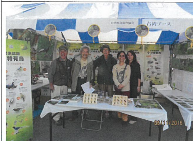
日本友人到展場致意