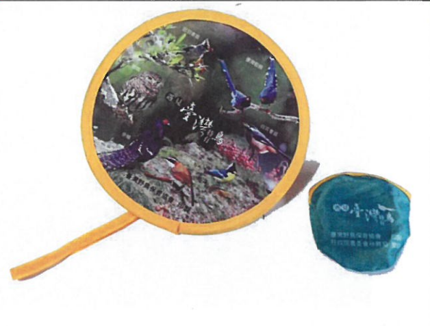
本會印製的文宣品—高碳記憶鋼絲折疊扇。