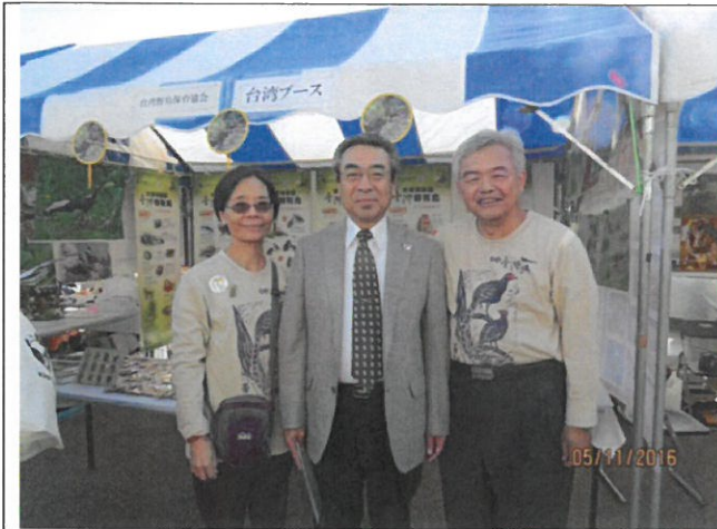
我孫子市青木副市長特別到本會攤位致意