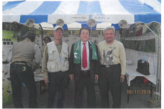
我孫子市市長星野順一郎特別到本會攤位致意