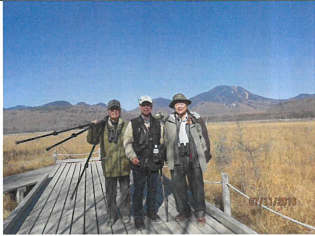
與日本友人參觀考察生態保存完整的日光國立公園。