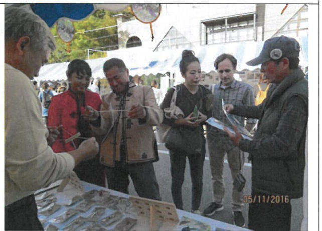
蒙古代表也來參觀寒喧