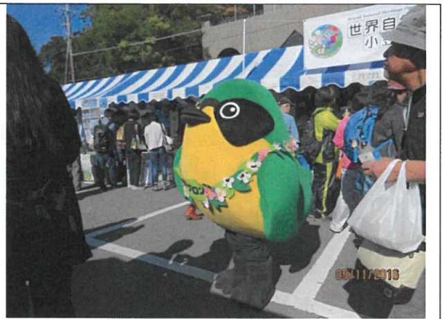
現場有來自小笠原諸島的參展木偶