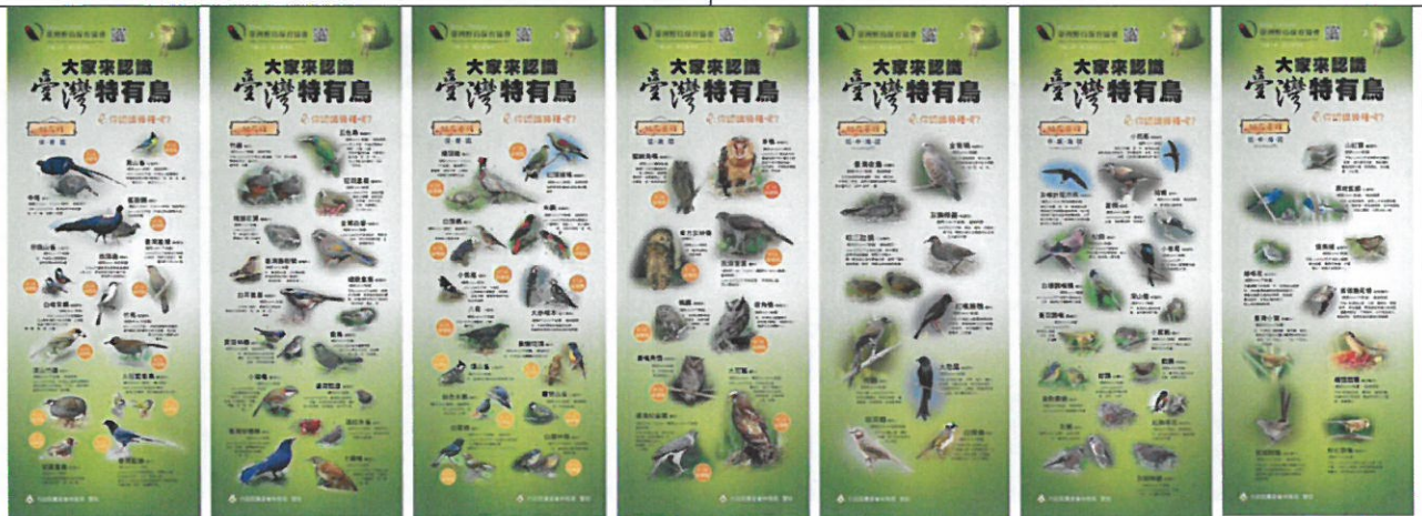
本會印製的易拉展掛圖展出效果極佳，吸引參觀民眾的目光，發揮推廣及提升臺灣在日本的能見度。