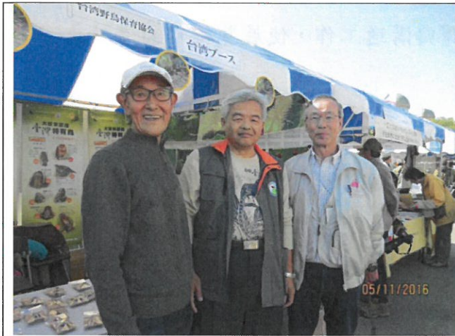
一早日本友人及我孫子野鳥保護協會理事長(右)就來致意