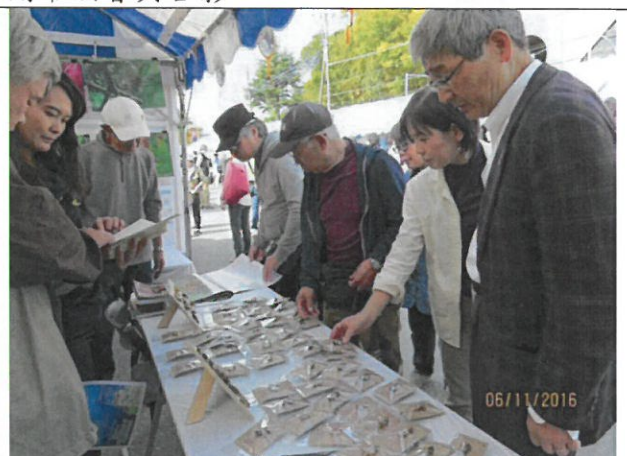
日本民眾對臺灣野鳥木雕藝術非常感興趣。