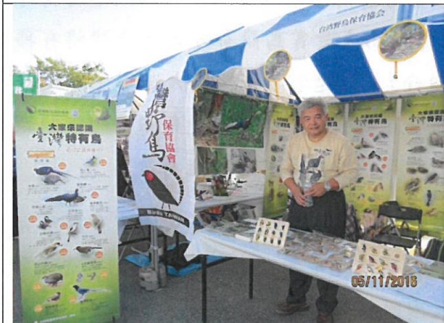
本會展示的臺灣特有野鳥易拉展及掛圖相當吸引參觀民眾的注意。