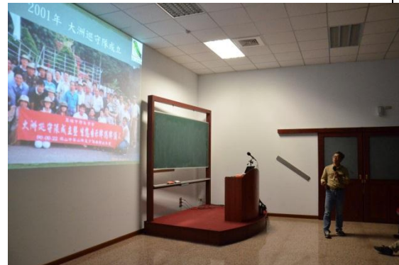
11/27 天台山一貫道天皇學院