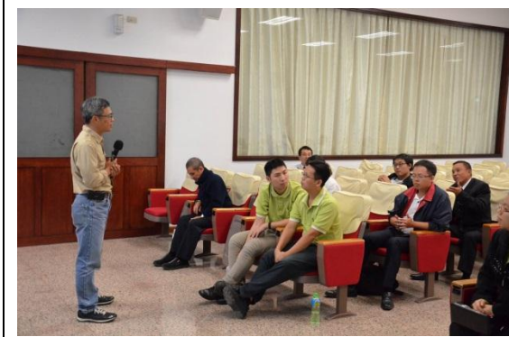
11/27 天台山一貫道天皇學院