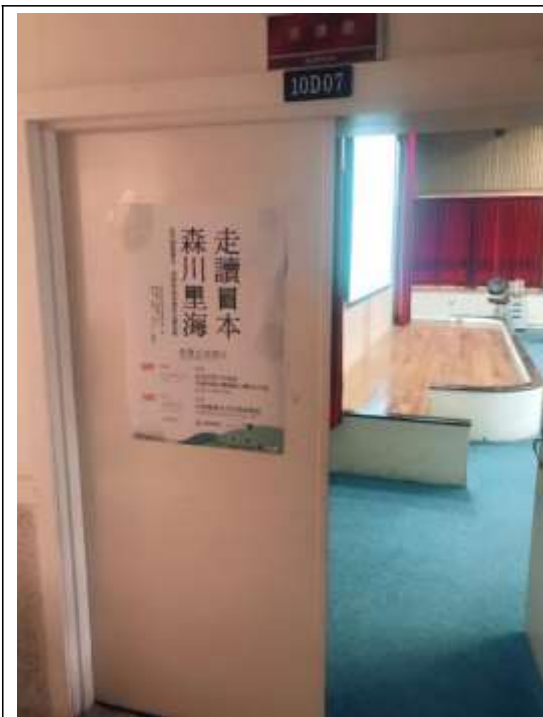
走讀日本分享會台中場海報