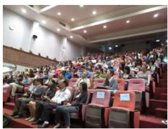
聽眾聚精會神的聽講