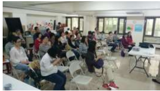
有許多民眾對里山議題有興趣