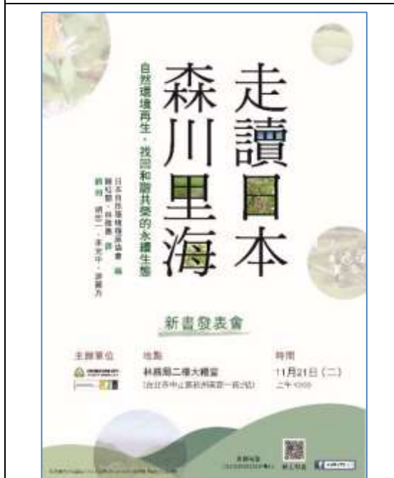
台北場活動海報 52X75 公分