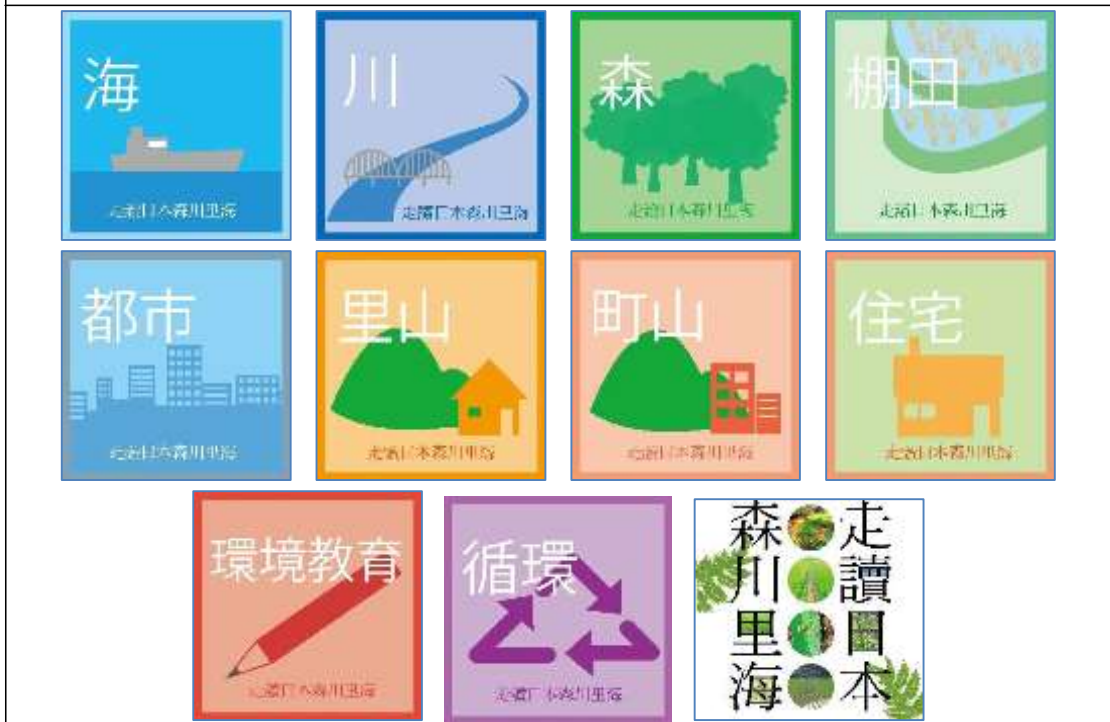
台北場活動手舉牌 50X50 公分