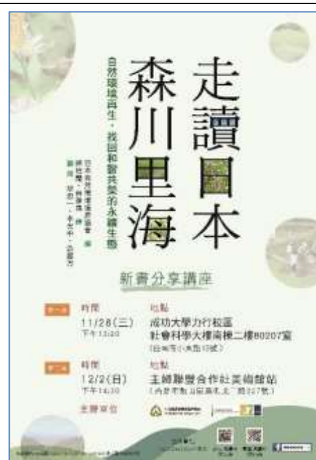
台南、高雄場活動海報 52X75 公分、A3 兩種尺寸