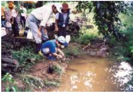
螢火蟲基金溪的維護。