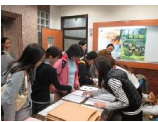
開講前報到台狀況