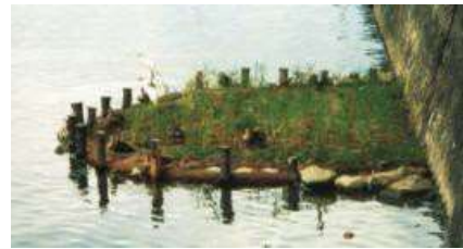
滿潮時，可在實驗苗床看見黑嘴白鷺鷥。