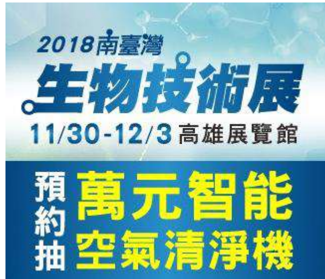
早鳥好禮及入口牌樓