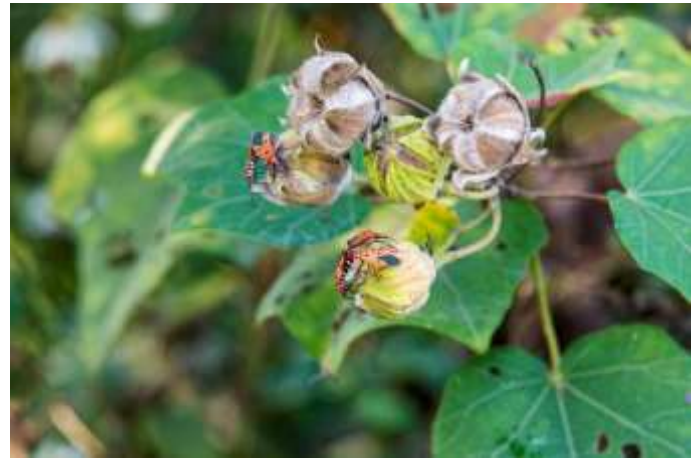
在山芙蓉上的赤星椿象