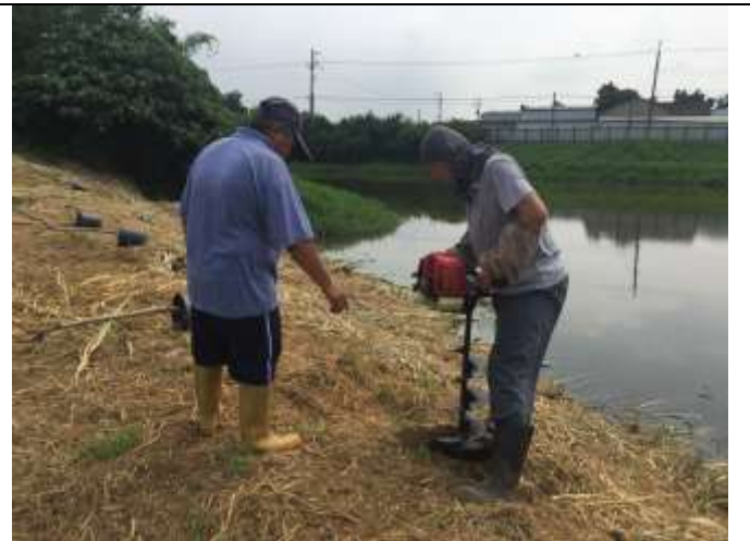
相片說明：濕地棲地維護-濕地周遭植樹