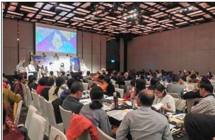
相片說明：2018 宗教護生發表會實況