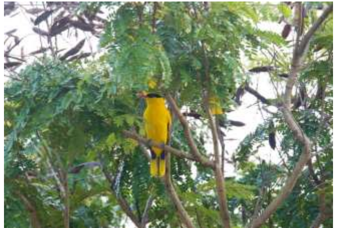
四季皆觀察到一級保育留鳥-黃鸝