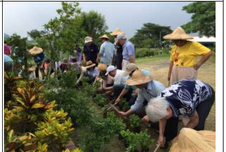
相片說明：濕地棲地維護-濕地瞭望台植樹