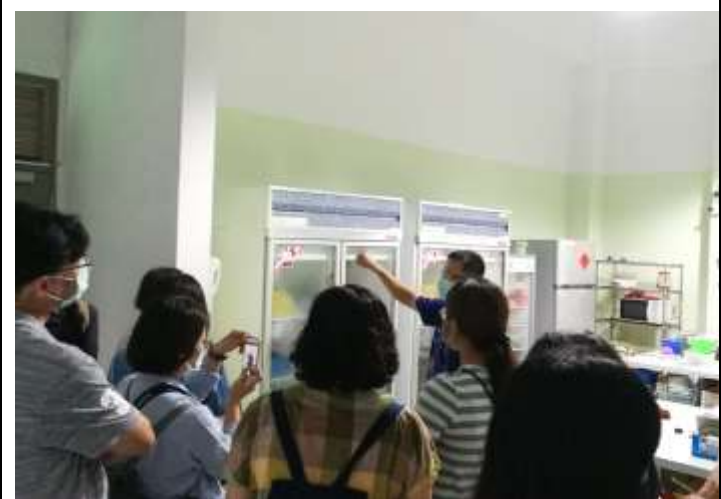
相片說明：參訪特生中心野生動物急救站 2