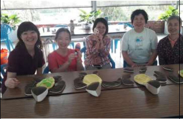
相片說明：愛龜俱樂部- 手縫工作坊 3