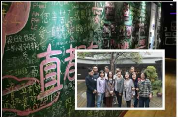
相片說明：培訓課程 2:科技應用於解說教育@靜思堂