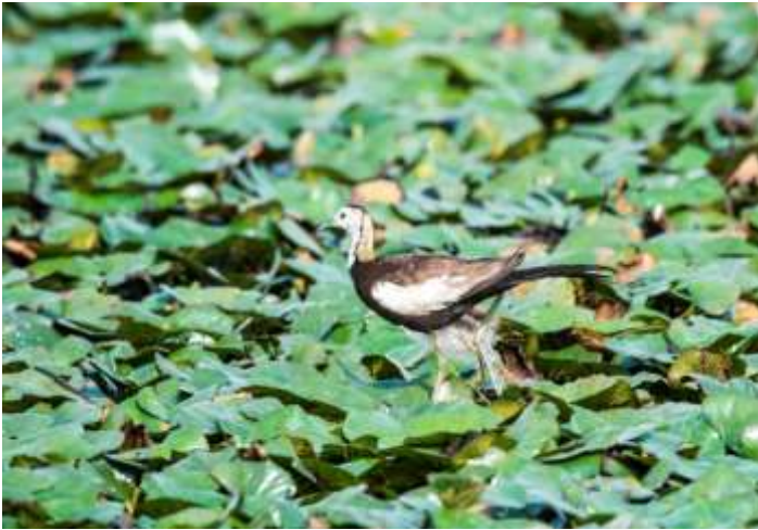
四季皆觀察到二級保育稀有留鳥-公水雉與幼雛