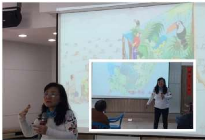
相片說明：環境教育教學法-荒野保護協會