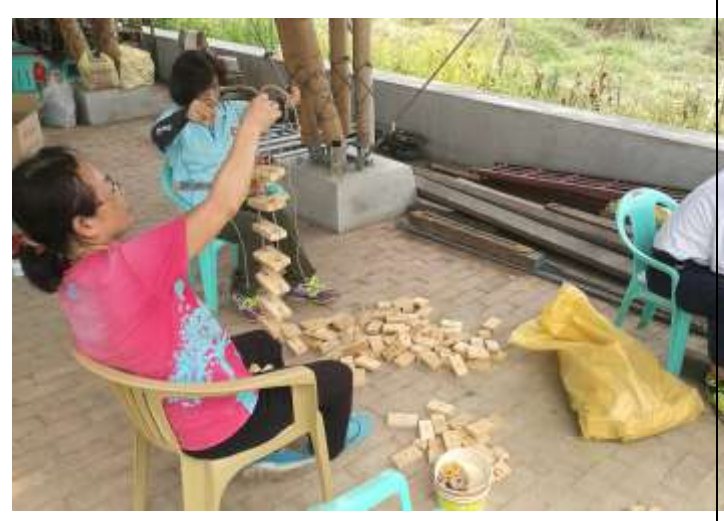
相片說明：鸚鵡環境豐富化-製作鸚鵡玩具