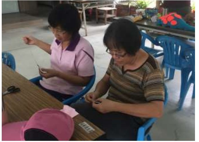
相片說明：愛龜俱樂部- 手縫工作坊 2