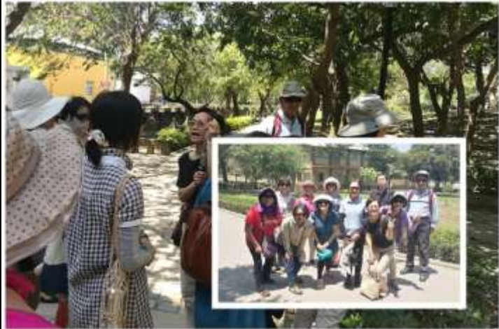
相片說明：培訓課程 3:認識台灣原生物種@原生植物園