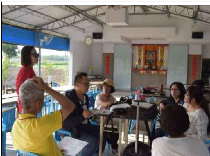
相片說明：教育宣傳影片籌備會議