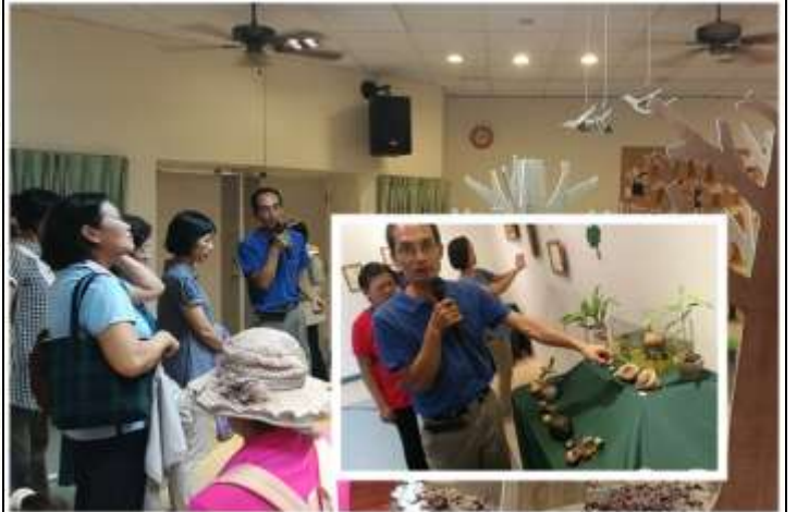
相片說明：培訓課程 4:學習營造靜態展示@文府國小