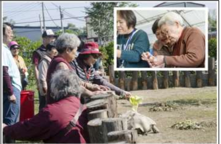
相片說明：開發年長者樂齡課程