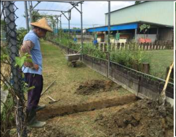
相片說明：象龜舍與食農區排水工程