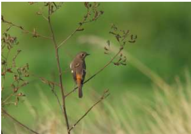
11 月開始，黃尾鵪來台過冬