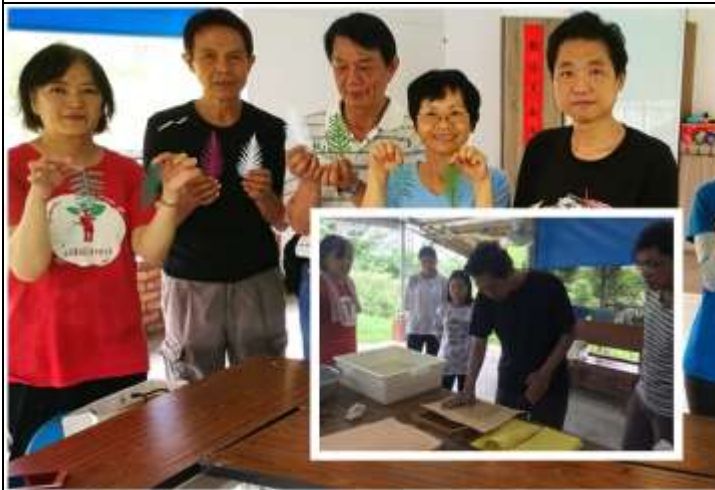
相片說明：環教實作教案開發-神奇的構樹朋友-手抄工作坊