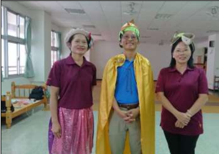
相片說明：護生戲劇編排與演練