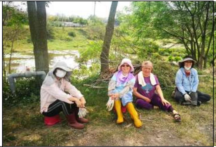
相片說明：濕地棲地維護-雜樹與雜草移除