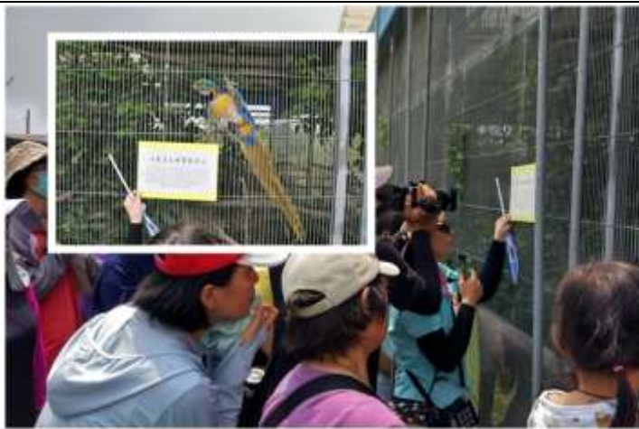
相片說明：參訪融入陪伴動物互動體驗課程