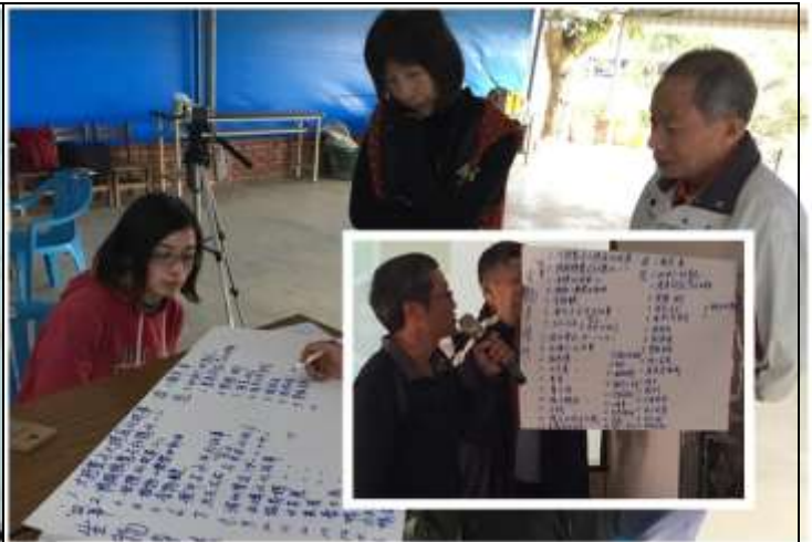
相片說明：戶外環境教育規劃 - 教案分享共學