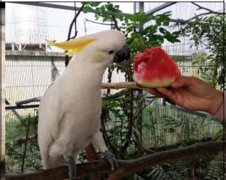
相片說明：鳥園食物豐富