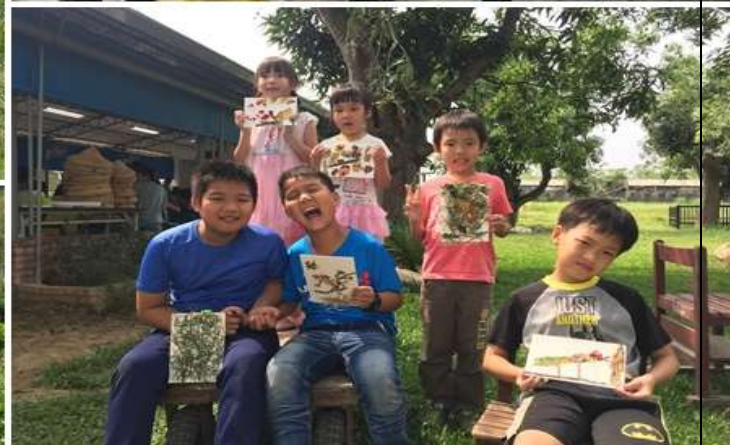
相片說明：2018 年全新系列體驗實作課程