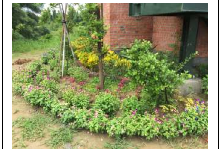
相片說明：濕地棲地維護-濕地瞭望台植樹