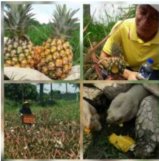
相片說明：收穫好心情- 食農小體驗 3 鳳梨篇