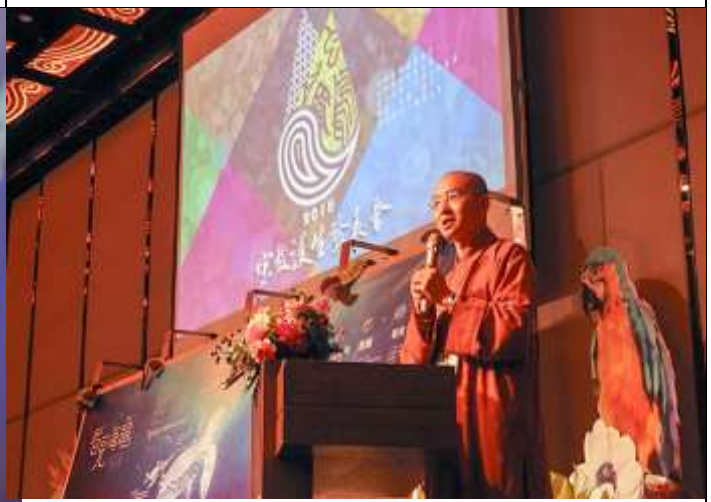
相片說明：福智僧團副住持如得法師以「佛教放生演變遞延」為主題，透由佛教經典、放生歷史發展脈絡切入，探討當代護生的意義