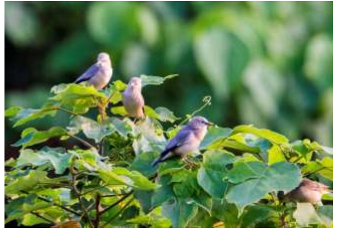
四季皆觀察到稀有鳥種-灰頭椋鳥