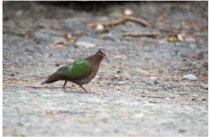
不普遍留鳥-翠翼鳩