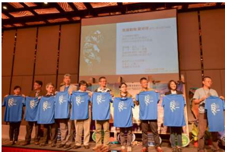
相片說明：與會貴賓們為承諾共同守護台灣野生動物合影