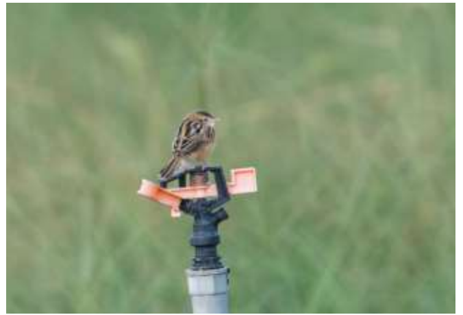
不普遍留鳥-棕扇尾鶯