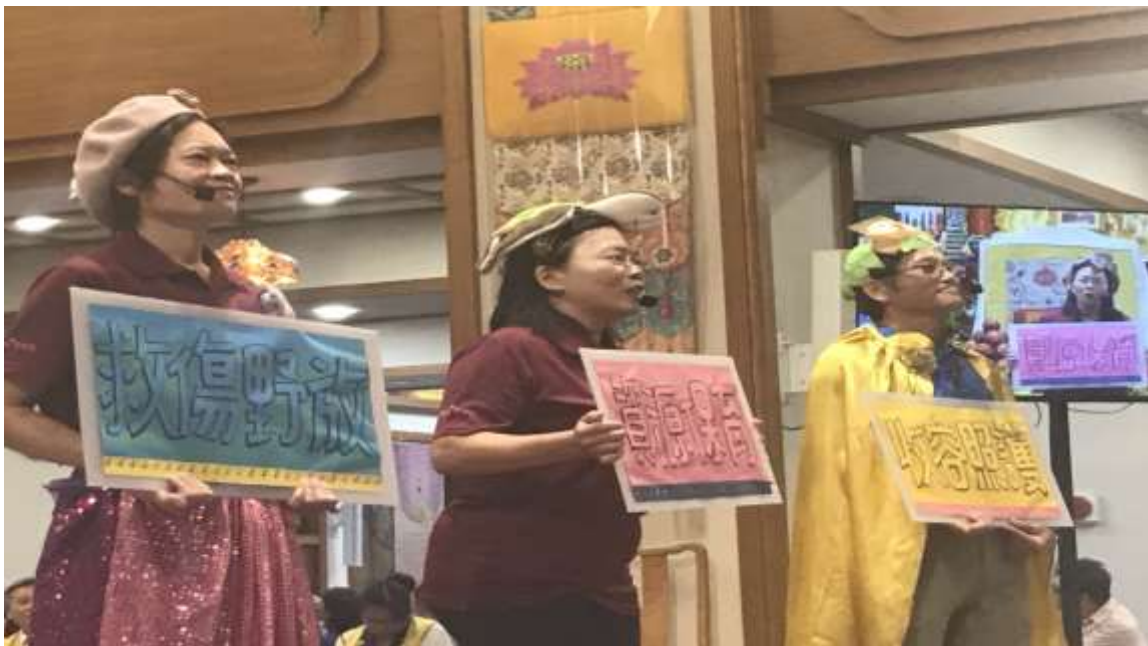
相片說明：護生教育戲劇推廣