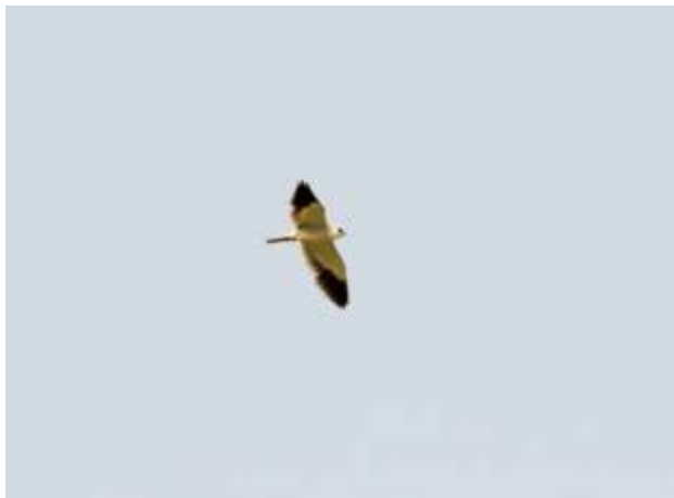
第一季至第三季皆觀察到二級保育鳥種-黑翅鳶