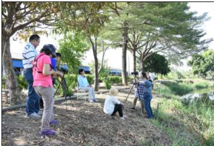
相片說明：專業攝影團隊