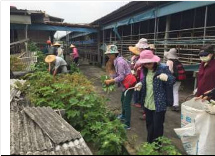
相片說明：濕地棲地維護-雜樹與雜草移除