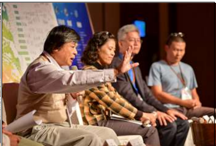
相片說明：產官學研與談實況