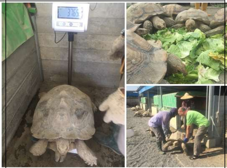
相片說明：象龜健康體檢