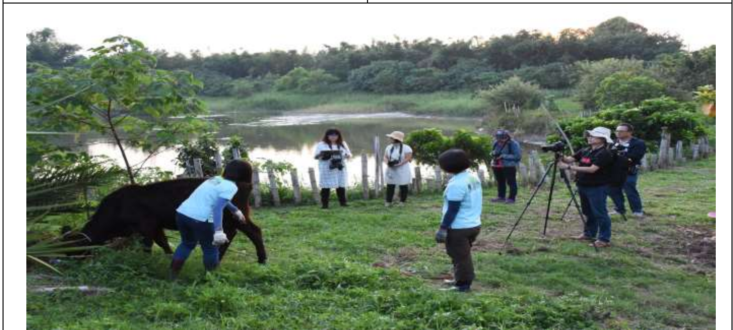
相片說明：教育宣導影片實際拍攝現場