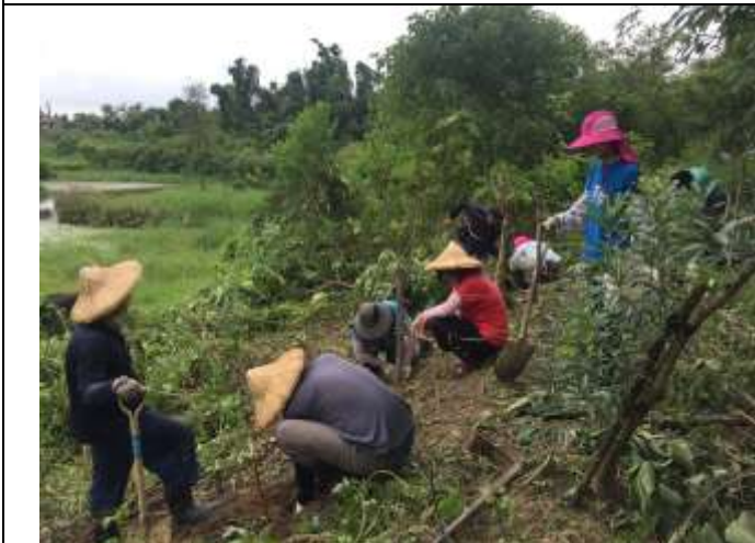
相片說明：濕地棲地維護-雜樹與雜草移除