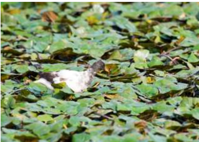
第四季觀察到白子紅冠水雞