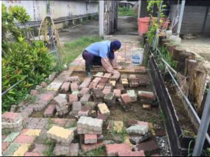
相片說明：象龜步道綠景營造