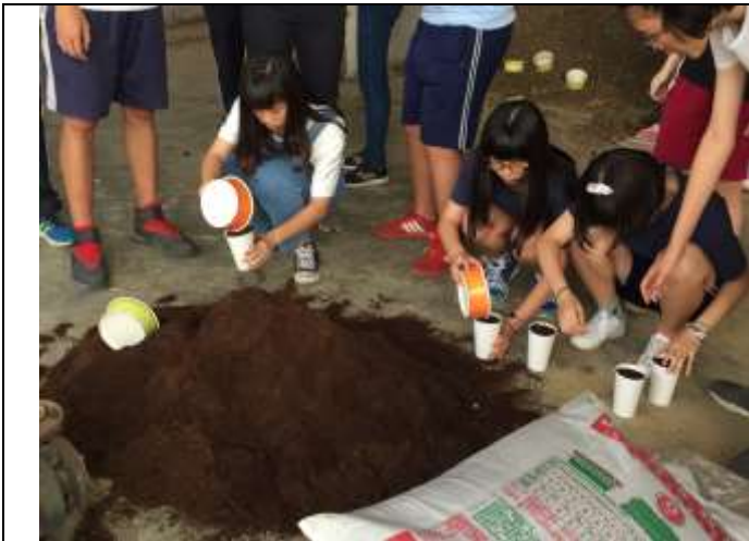
相片說明：食農教育推廣-與食物的浪漫相遇 1