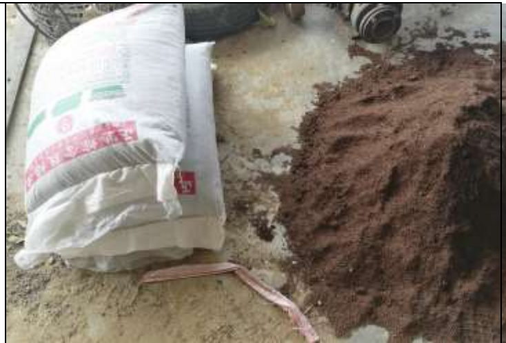
相片說明：食農教育推廣-與食物的浪漫相遇 2