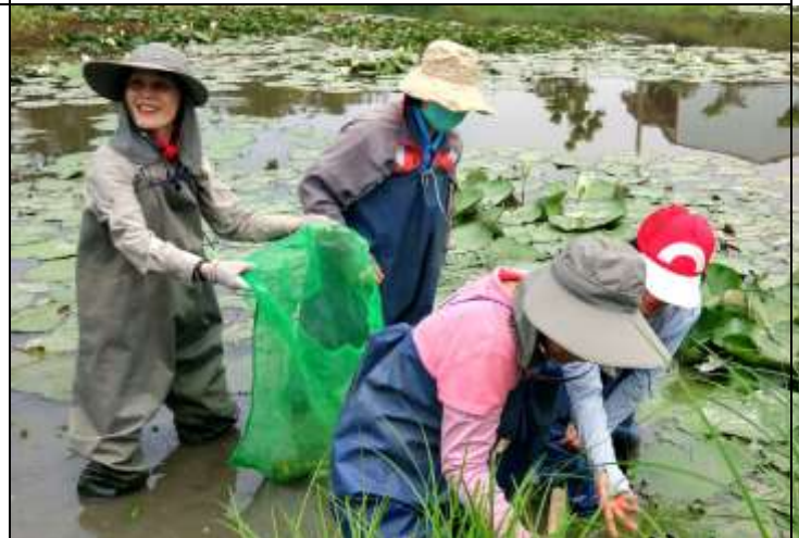
相片說明：濕地棲地維護-濕地強勢植物移除