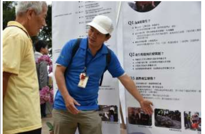
以靜態展板介紹當代護生事業