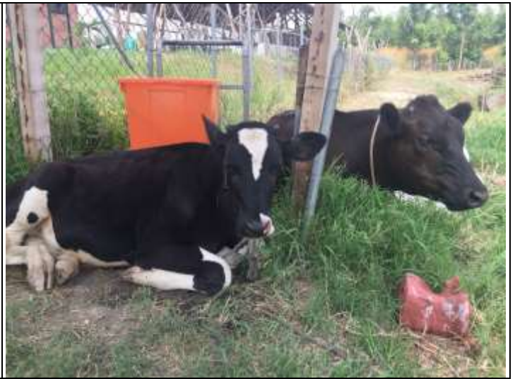
相片說明：牛照養區