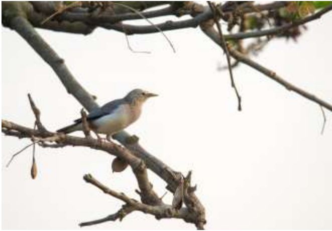
四季皆觀察到稀有鳥種-灰頭椋鳥