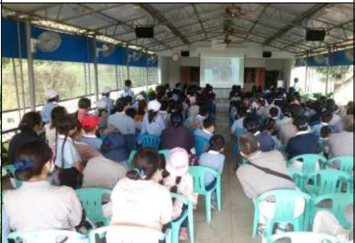
相片說明：在各場域進行放映宣導