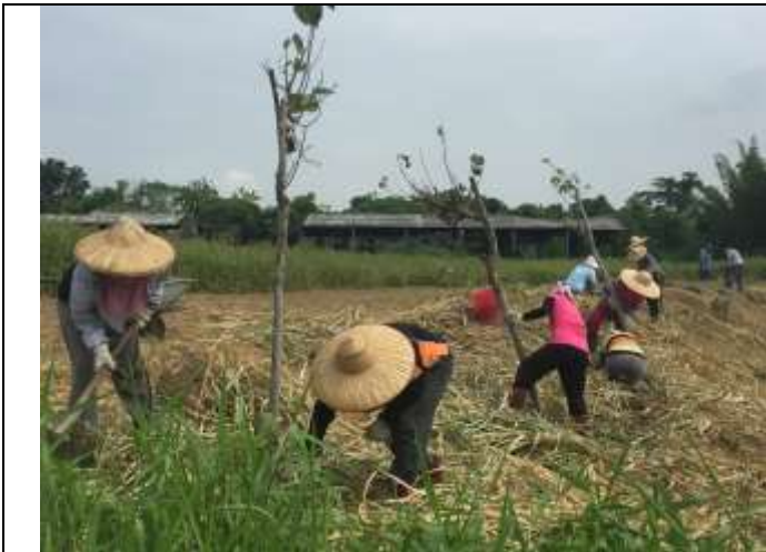
相片說明：濕地棲地維護-濕地周遭植樹