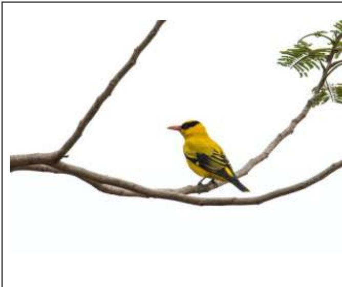
四季皆觀察到一級保育留鳥-黃鸝