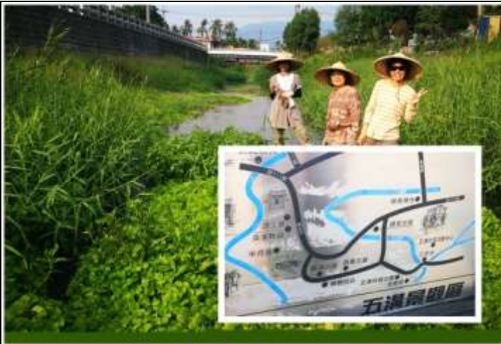
相片說明：培訓課程 1:實地認識溪流物種@五溝水