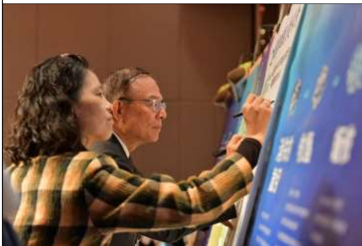
相片說明：「救護動物、愛地球」護生行動宣示