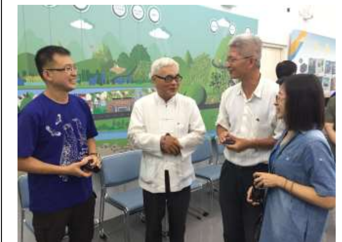
相片說明：參訪特生中心野生動物急救站 1