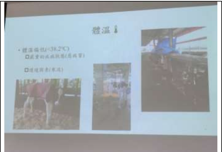
相片說明：我們的牛朋友-牛醫生專家演講 2