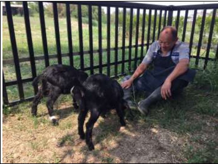
相片說明：小羊放牧與陪伴照養