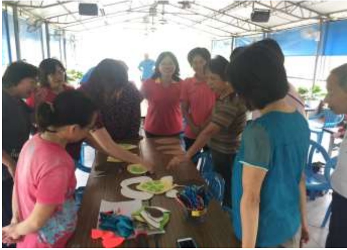
相片說明：愛龜俱樂部- 手縫工作坊 1