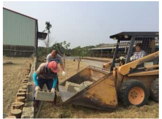
相片說明：象龜步道綠景營造