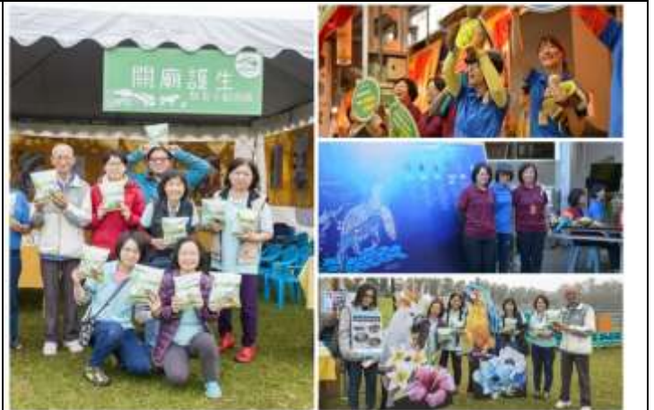
相片說明：各大活動法會宣傳護生教育