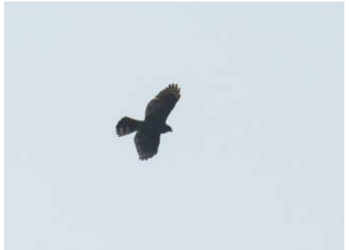
二級保育留鳥-松雀鷹