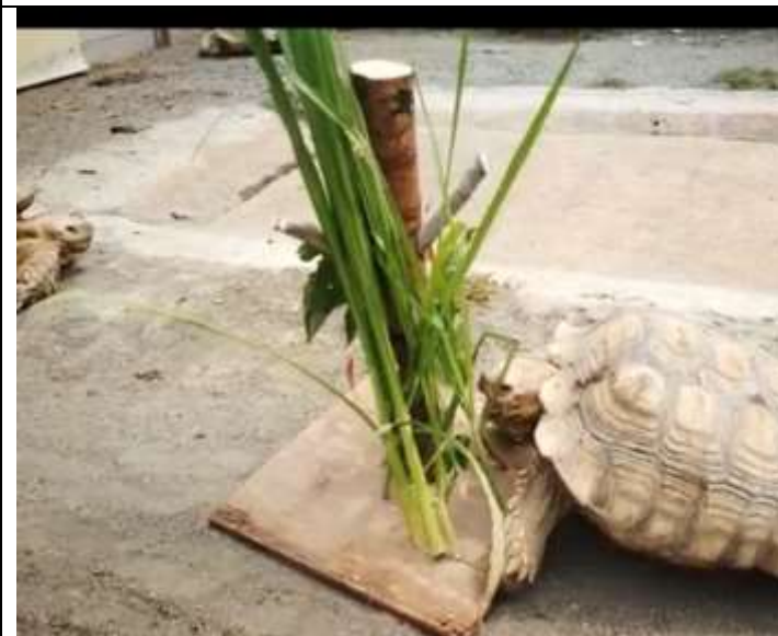
相片說明：新增象龜餵食器皿