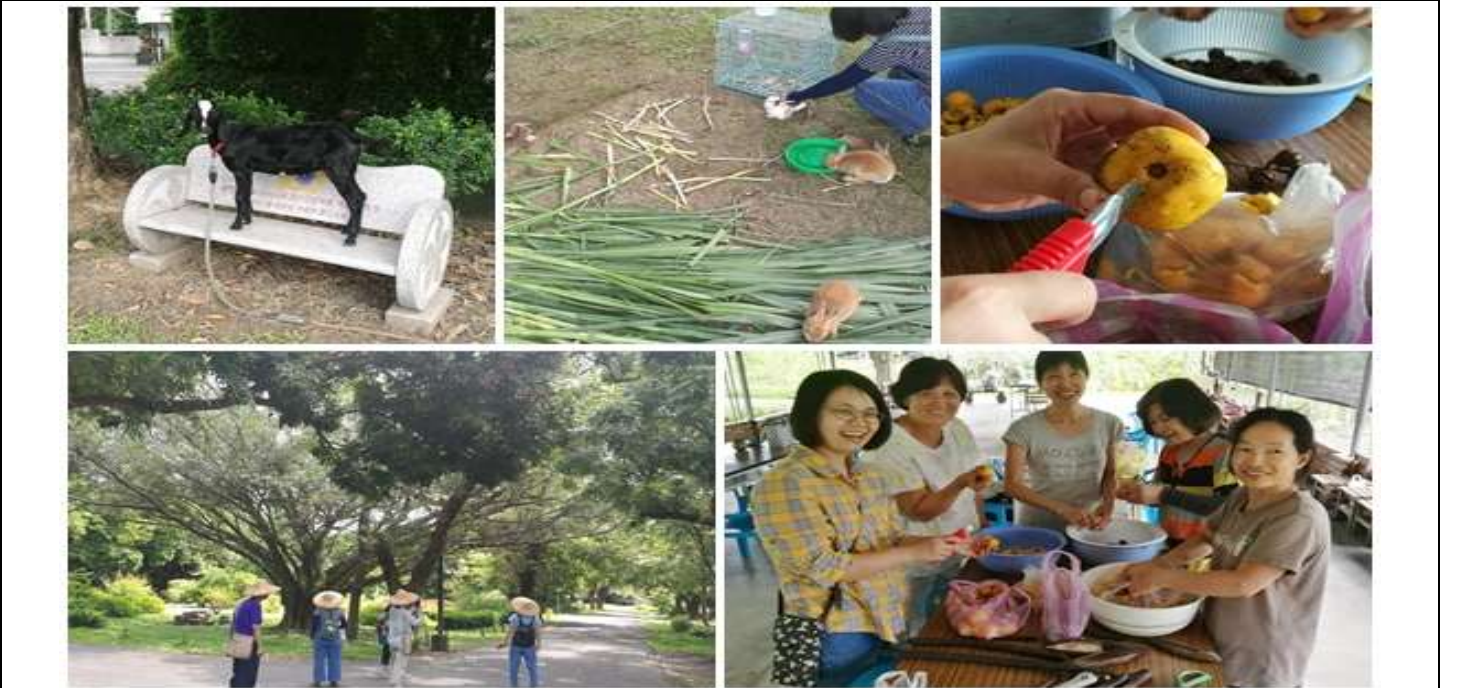
相片說明：培訓課程 5:講說演練與種子實作工作坊@橋頭糖廠與糖廠國小