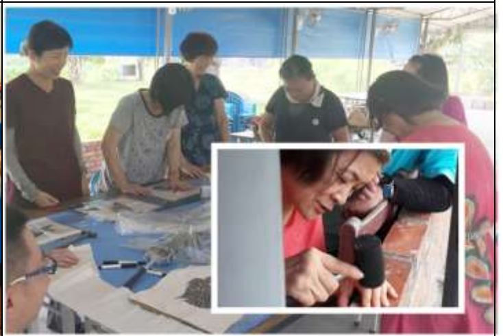
相片說明：環境教育實作課程-槌染體驗課程