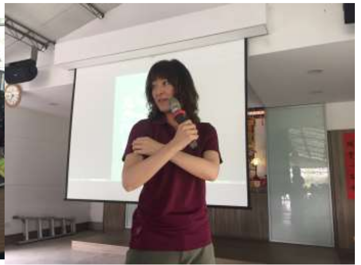
相片說明：愛龜俱樂部- 手縫工作坊 4