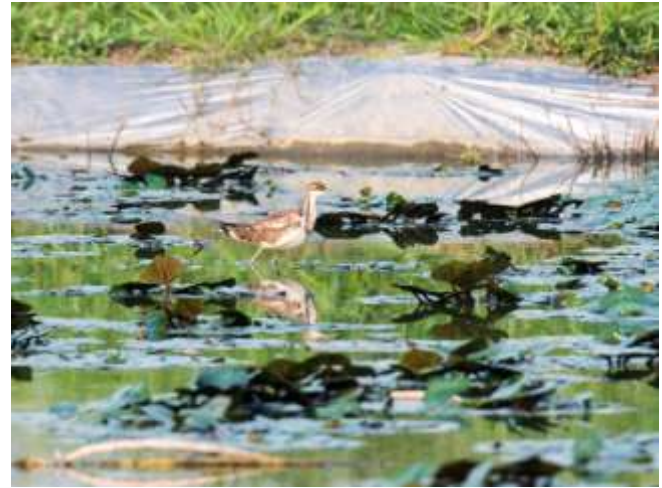
四季皆觀察到二級保育稀有留鳥-水雉〈亞成鳥〉