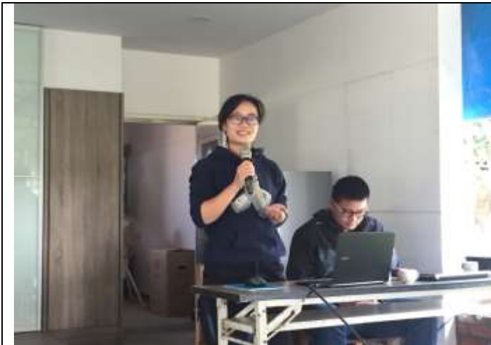
相片說明：我們的牛朋友-牛醫生專家演講 1