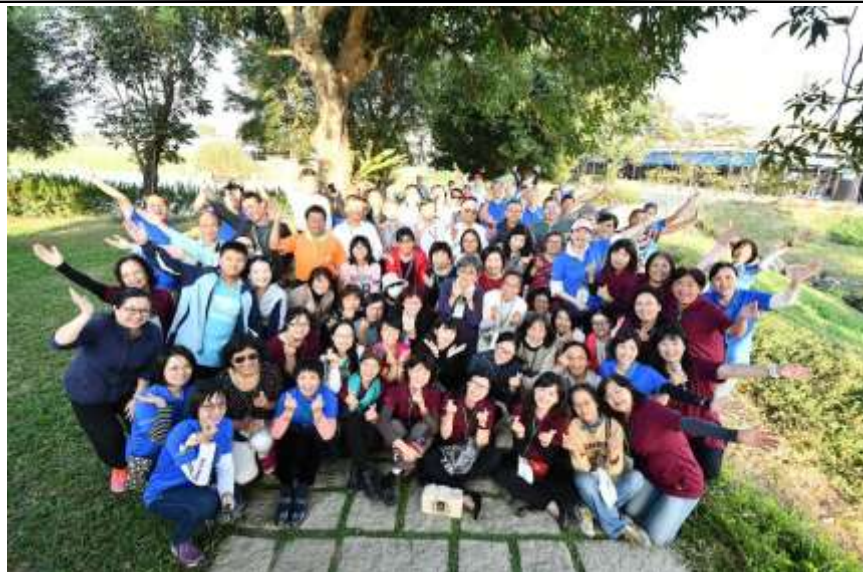
相片說明：貴賓媒體至護生園參訪與交流