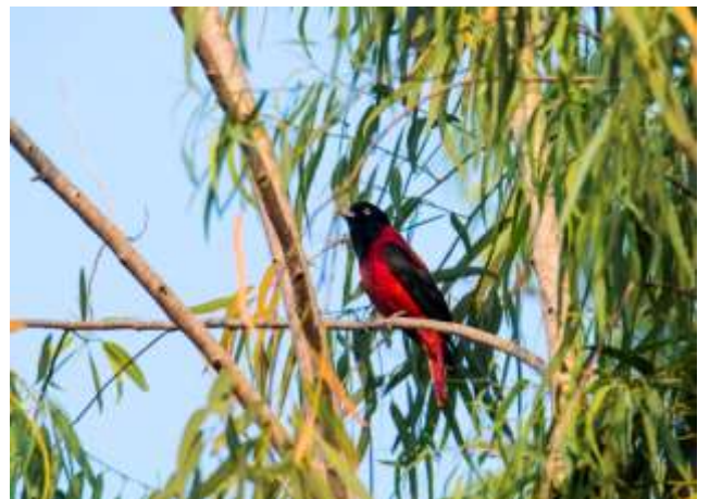
10 月觀察到二級保育類留鳥-朱鸝