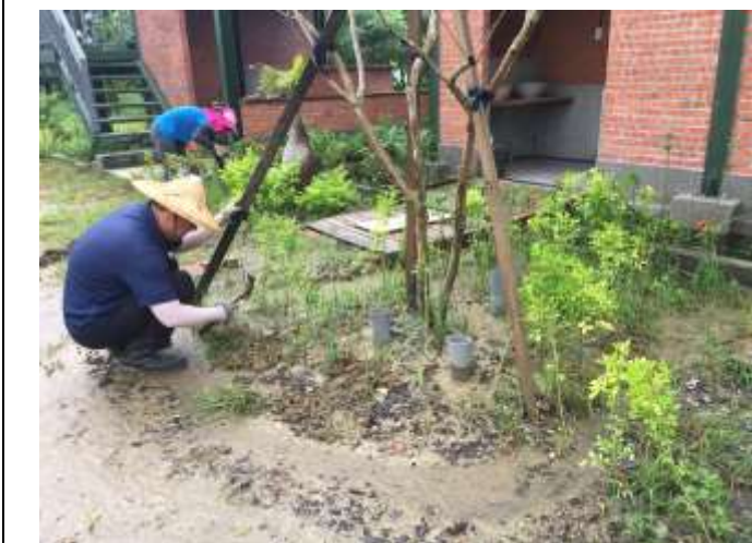
相片說明：濕地棲地維護-濕地瞭望台植樹