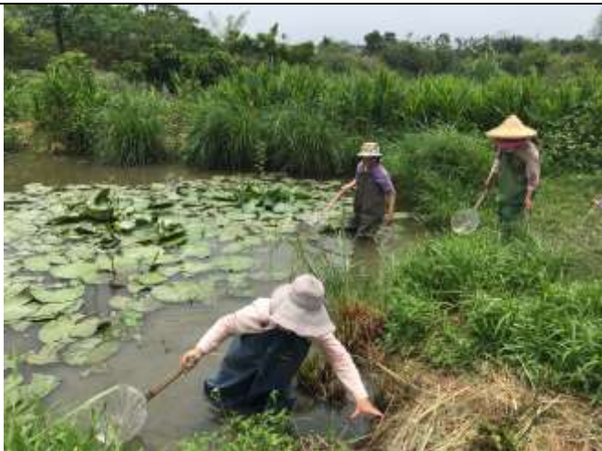
相片說明：濕地棲地維護-濕地強勢植物移除