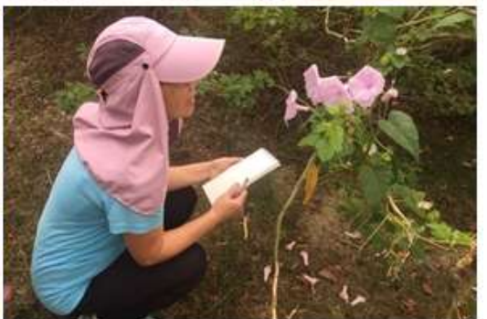
相片說明：環境教育植物知識解說-解說提升系列課程