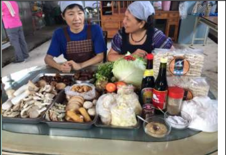
相片說明：蔬食護生料理課程開發-社區推廣課程