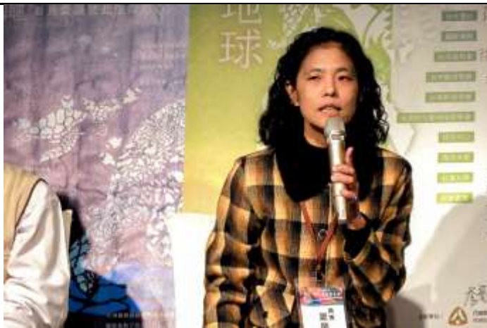
相片說明：夏組長與各界產官學研進行交流座談