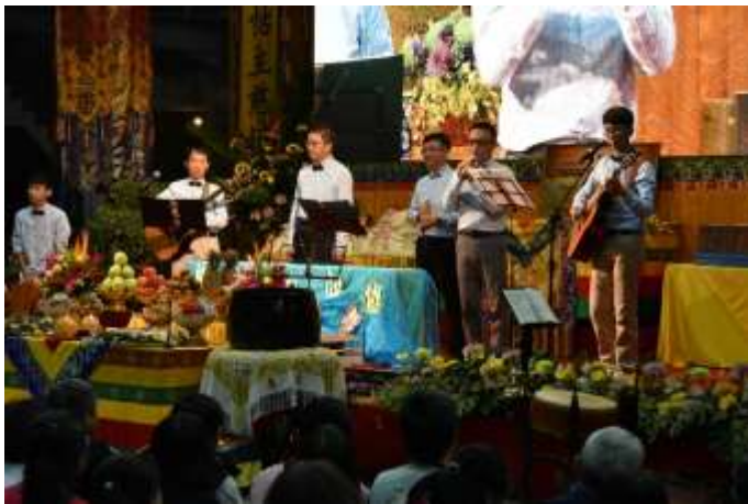
善男子樂團帶動歡唱生命協奏曲