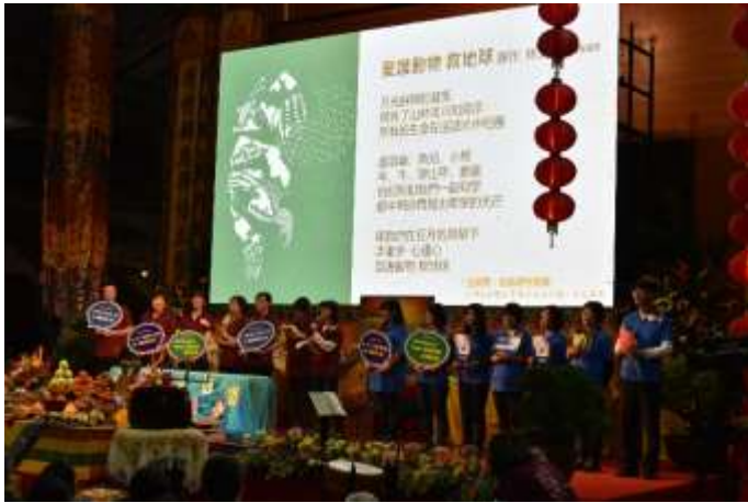
護生地圖成果介紹