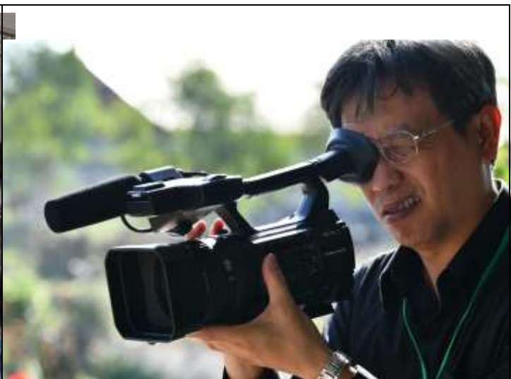
相片說明：專業拍攝器材