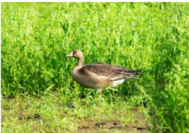
11 月份首次在歸仁地區觀察到白額雁