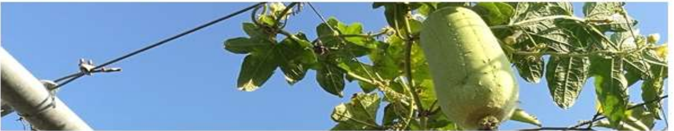
相片說明：可食地景營造、推廣與收穫