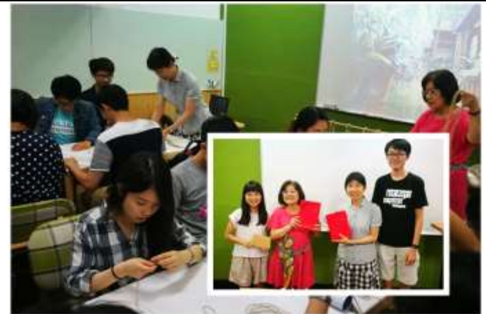
相片說明：前往成大宣傳護生教育與麻繩袋動手做