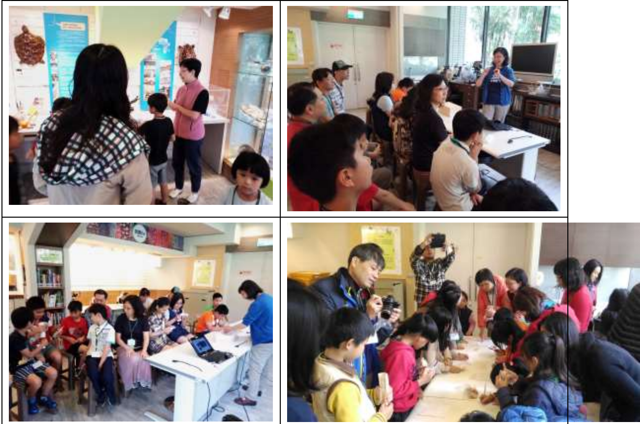
圖四、結合觀展、課程與體驗活動的親子宣導講座進行情形

之野生動物產製品與屍體，本年度共計協助處理來自台中地檢署、苗栗縣政府、台中市政府轉送之違法案件沒入產製品包括象牙製品、玳瑁標本以及石虎屍體等，共計 3 案次。