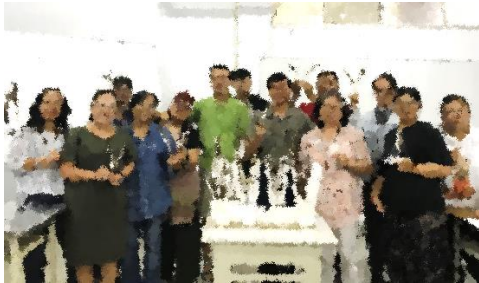
圖五、第一週次與會學員製作成品及授課講師合照(左)