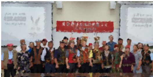
圖一、參與的部落人員大合照(左)

2018 年 9 月 21 日(星期五)於國立屏東科技大學管理學院會議室舉辦，現場計 47 人參與，其中包含部落領袖 11 人、原住民朋友 10 人、來賓 9 人、屏科大工作人員 16 人、記者及紀錄報導 1 人(圖一、圖二)。