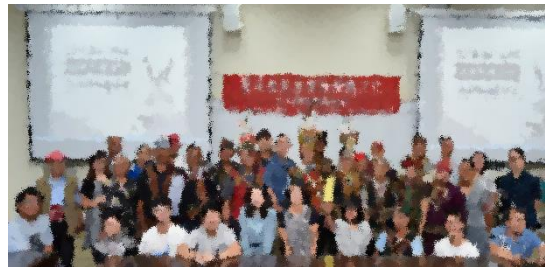
圖二、活動參與人員大合照(右)