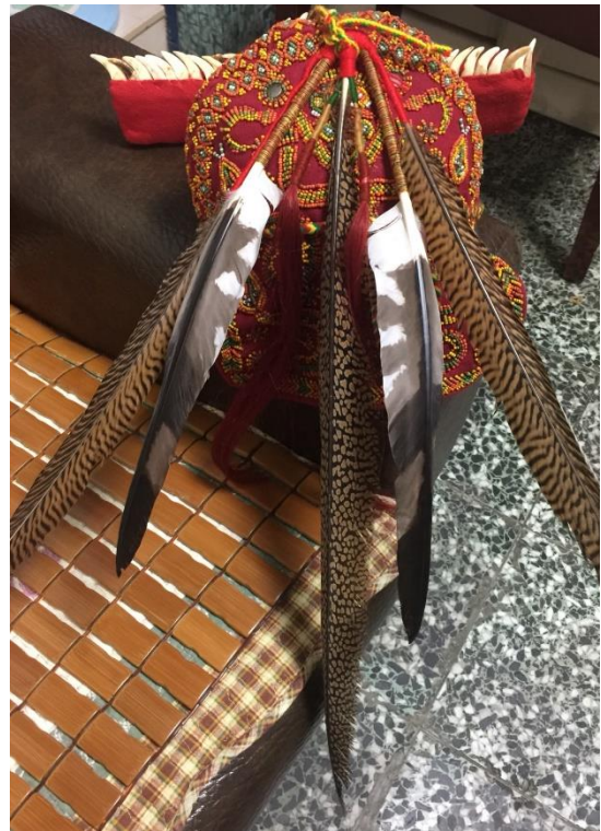
圖十一、學員課後練習製作的成品