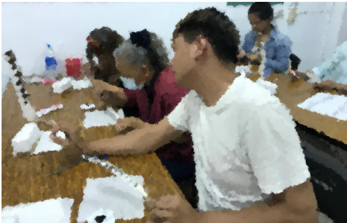
圖七、參與學員專心繪製的過程

參與的學員除了高度認同熊鷹保育，也提到願意帶著所學到的技術回部落推廣替代，多位學員將製作成品應用在 2018 年 7 月底於部落展開的豐年祭之中。此外，多位學員詢問可否舉辦進階課程，學習過程中認真且充滿藝術細胞的原住民學員，將所學與部落藝術進行結合，利用課後之餘不斷的練習，製成成品也因在大型豐年祭活動中使用，可增加其他族人的認同感。