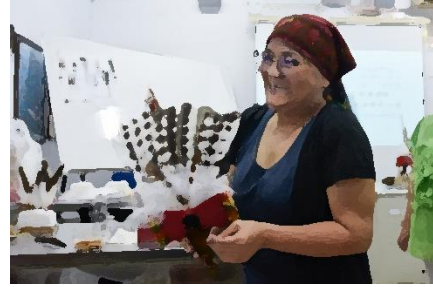
圖十、結業式時學員展示製作的成品(右)