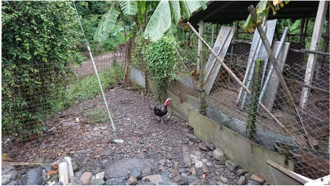
圖十四、雞舍圍網防治野生動物的方式一周圍圍網(開放式飼養)