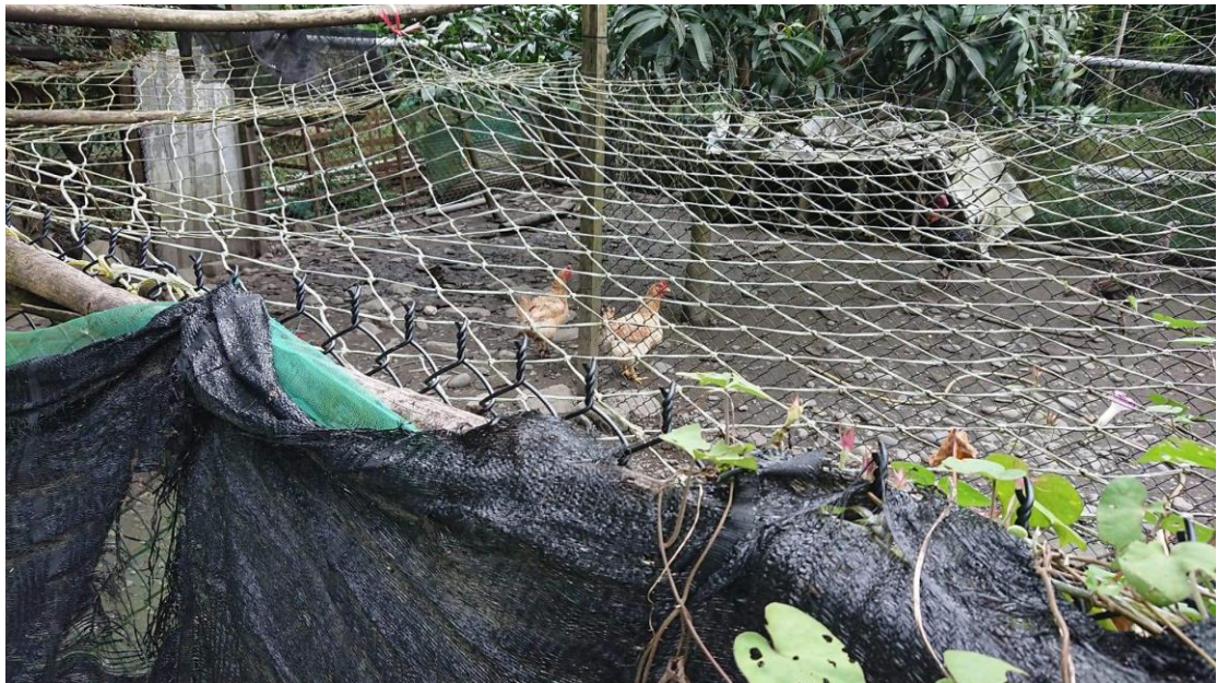
圖十三、雞舍圍網防治野生動物的方式一屋頂式圍網(開放式飼養)

20 位受訪者中，雞舍以開放式飼養有 16 位、僅有 3 位採用封閉式飼養，飼養空間平均為 14.2 坪。開放式飼養的雞舍形式為露天，外有圍籬，蓋有遮風避雨的小寮(圖十三、圖十四)，有部分受訪者表示小雞時期才會以小籠子封閉式飼養，一定大小後再放養至開放空間。