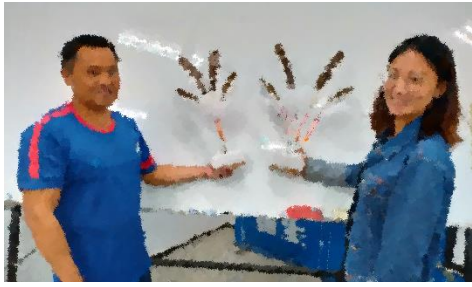
圖九、第四週次學員完成的仿製熊鷹羽毛成品(左)