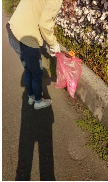
圖 2：濕地周邊道路環境維護