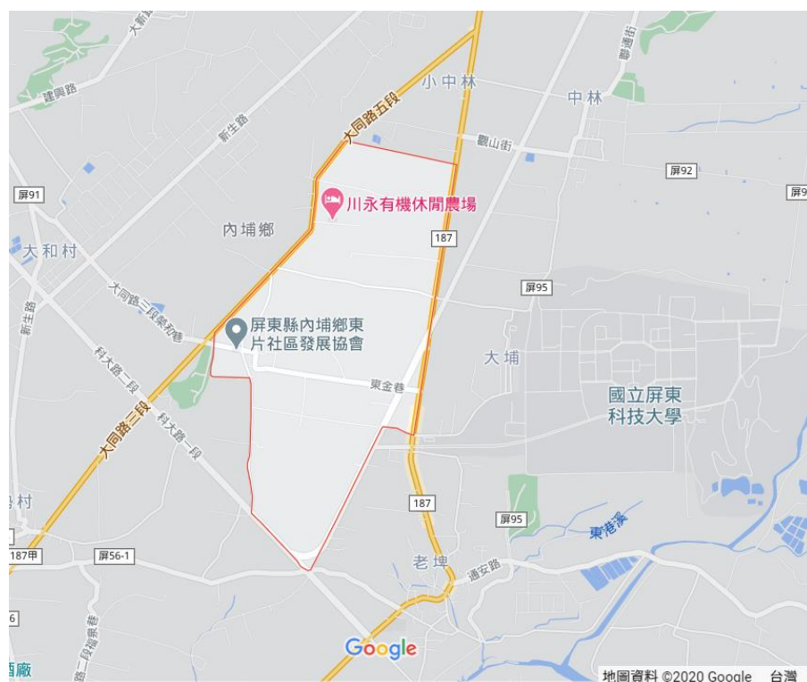
圖一、屏東縣內埔鄉東片社區位置圖