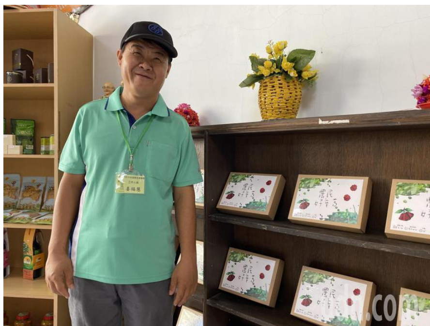
圖三、「農民好辛苦」桌遊照片