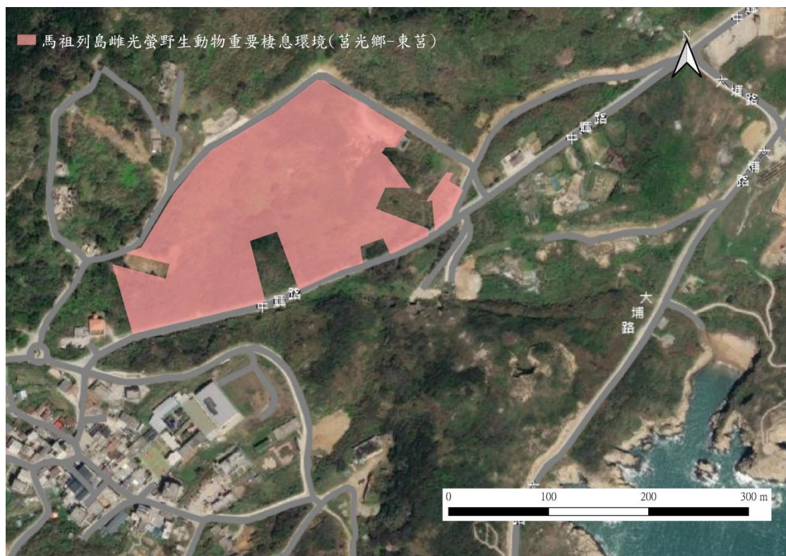
圖二、馬祖列島雌光螢野生動物重要棲息環境(莒光鄉東莒範圍)