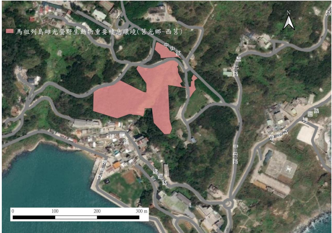
圖三、馬祖列島雌光螢野生動物重要棲息環境(莒光鄉西莒範圍)