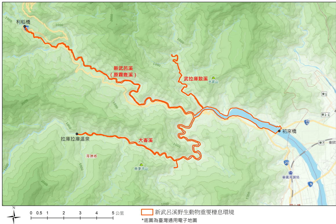
臺東縣海端鄉新武呂溪野生動物重要棲息環境範圍圖