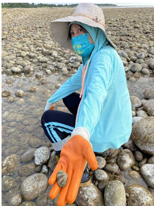
▲海邊唾手可得，隨便一挖就是個頭不小的海瓜子，意味著在地豐富的自然生態。

「大家之前都有上過課，知道該怎麼做。」她說。有別於澎湖，主要以啫咕石、玄武岩修砌的石滬，新屋大多是就地取材，以