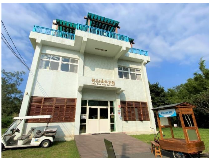
▲成立於 110 年的石滬故事館，是推廣在地自然生態、環境教育的重要之地。

110 年成立的石滬故事館，更是里山倡議精神中的具體落實。白色的外觀，看起來典雅而新穎，走進室內，從一樓漁滬文化導覽區到二樓海創客教室，每一個設計和布置都寫滿了在地人的用心。尤