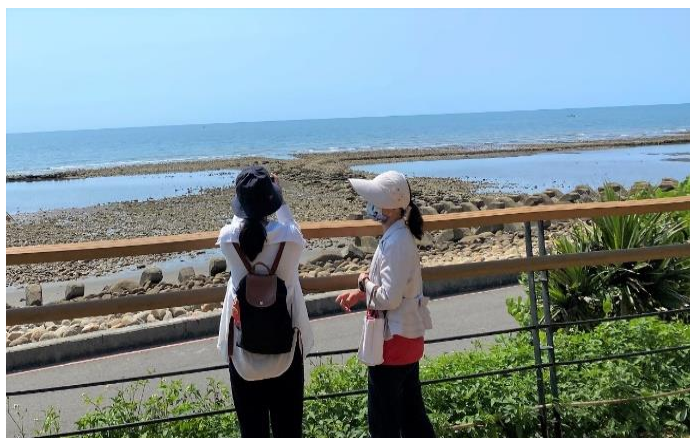
▲透過生態導覽旅行，許多人得以看到新屋美麗而獨特的一面。

於是，以他為首的義消，在地的一群人開始積極籌備「愛鄉」。96年協會成立後，只是開始的第一步，緊接著在林務局的協助下，不僅逐步加強森林保護計畫，並開始辦理一系列的活動，加入親子教育課程。在這同時，最重要的是在發掘石滬的過程中，進行在地資源的盤點、師資的培訓，以及一系列的環境教育、生態導覽小旅行等等。