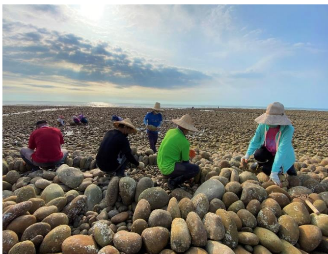
▲只要有空，在地人常自發性地主動前往海邊修復石滬。

「因此，現在只要潮水適合，我們都會動員大家一起來修復，有時候是天天，有時候則是間隔幾天，主要還是看潮汐的狀況。」其中一位志工說道。她說，平時大家都有正職，水電工、計程車司機、工廠負責人等，工作時間較為彈性自由的人，只要有空都會主動過來幫忙修護石滬。