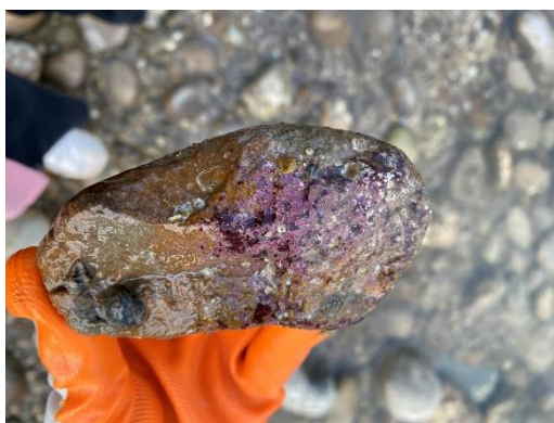
▲藻礁的生長速度非常緩慢，珍貴而稀少，不仔細看很難發現。

燦爛的陽光穿透過婆娑舞動的枝桠，陣陣的浪濤聲隨風飄散，夏日慵懶而閒適的氛圍，讓這裡盡顯悠情，也吸引著來自四面八方的遊客。再往前走，沙灘上礫石堆旁，隱藏在粼粼波光下的是宛如跨越過亙古綿長歲月而來的藻礁。不同於一般人所熟知由動物所形成的珊瑚礁，藻礁是由無節珊瑚藻類死亡鈣化後，沉積於礫石灘上所形成的礁體，「成長」速度緩慢，平均 10 年才可生成約 1 公分，珍貴而稀少。