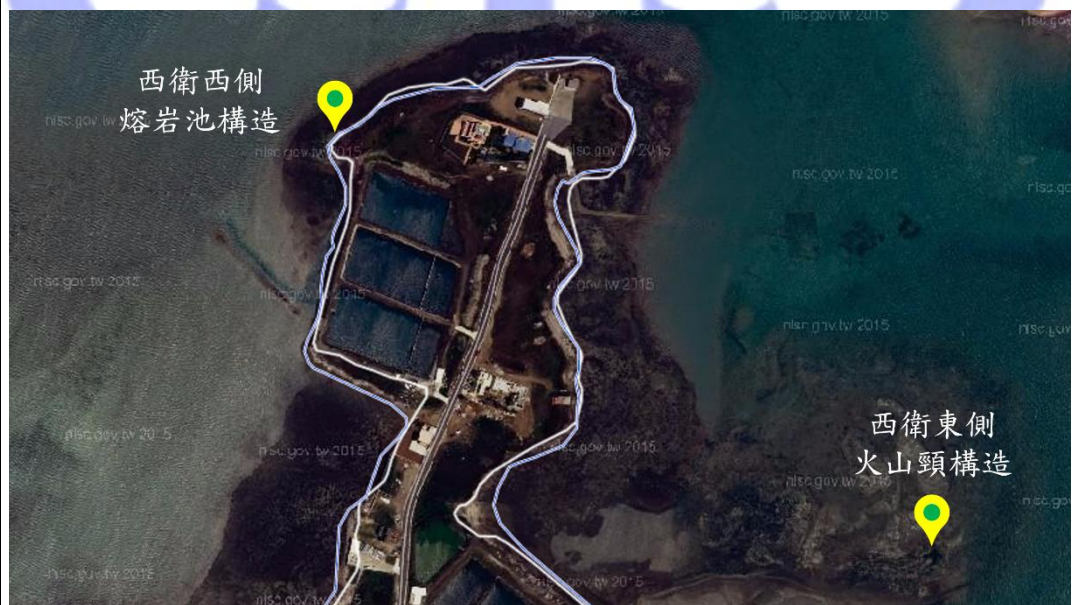
西衛西側熔岩池及東側火山頸位置圖（黃色標示處）