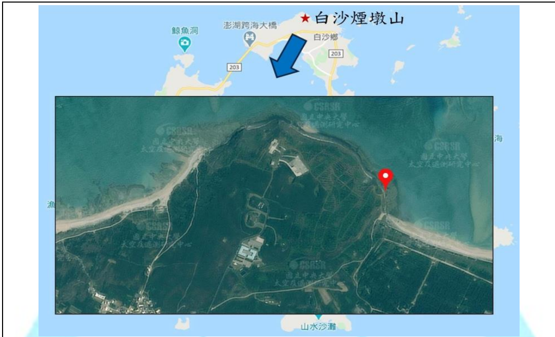
白沙鄉煙墩山低平火山口相對位置圖