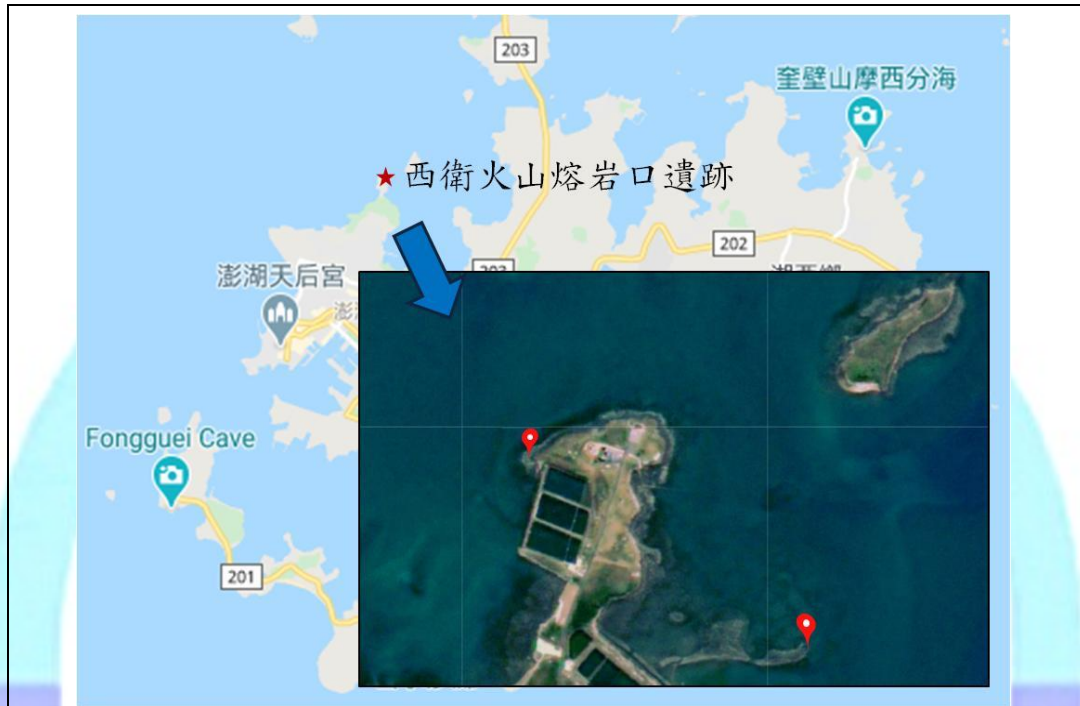
西衛西側熔岩池及東側火山頸相對位置圖（紅色標示處）