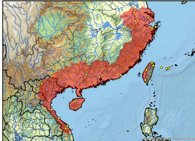
圖 1 柴棺龜 ( Mauremys mutica ) 的地理分布圖 (引自 Turtle Taxonomy Working Group, 2017)

過去有關於臺灣所採集記錄或報導柴棺龜的地點分布主要以北部的為主 (陳兼善, 1969; Wang and Wang, 1969; Mao, 1971) , 堀川安市 (1934) 亦認為其野生族群之相對豐度遠低於臺灣常見的斑龜, 且未在臺北以外地點捕獲或發現。近期的調查發現柴棺龜於臺灣的分布在北部、中部及東部靠山區水域及鄰近陸域環境, 並非呈現全島性分布, 且有明顯的塊狀分布現象, 主要在靠近山區之水塘、沼澤、溝渠等水域環境, 亦常利用周邊的陸域環境 (Chen et al., 2000; Chen and Lue, 2010) 。依據過去相關調查報告、通報記錄與司法院法學資料庫判決書之發現紀錄依相關縣市行政區域 (鄉鎮市區) 分布狀況如圖 2 所示, 分布於北部、中部及東部低海拔山區及人為改變或干擾程度較低的臺地或平原環境, 呈現廣泛性分布, 但於平原區環境的記錄不多。