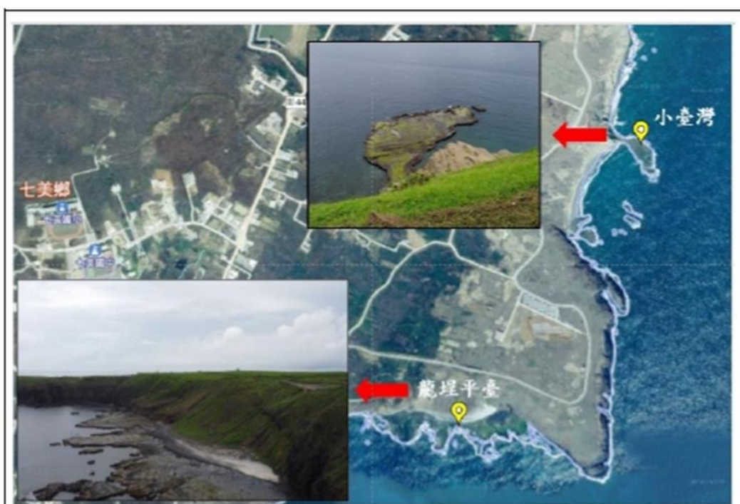
圖 6-龍埕與小臺灣位置示意圖