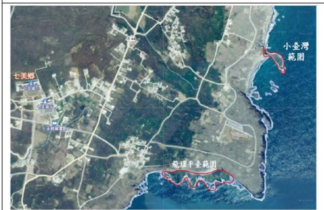
圖 7-龍埕與小臺灣範圍圖