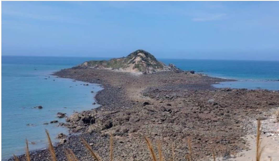
西牛嶼的陸連島地形及潮間帶

退潮時此地有大範圍潮間帶，潮間帶有許多火山角礫岩露出，可以看到花崗岩的碎塊膠結在一起，是來自白沙花崗岩與西莒凝灰岩，是相當特殊的岩石。且由於海灣內部寬廣，退潮時產生的潮間帶廣闊具有豐富的海濱生態，具有科學及環境教育之價值。